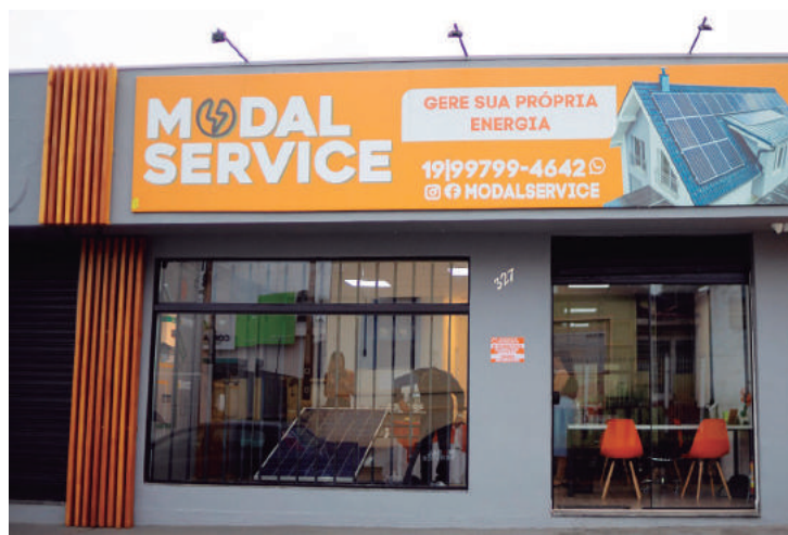
A Modal Service fica na Rua João Aranha, 327, Centro