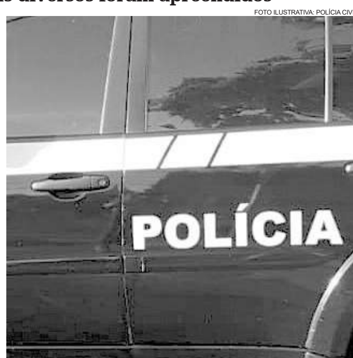
Ambos acusados têm 23 anos e residem em Cosmópolis

Foram apreendidos: 43 unidades de substância aparentando ser cocaína; 13 unidades de substância aparen-