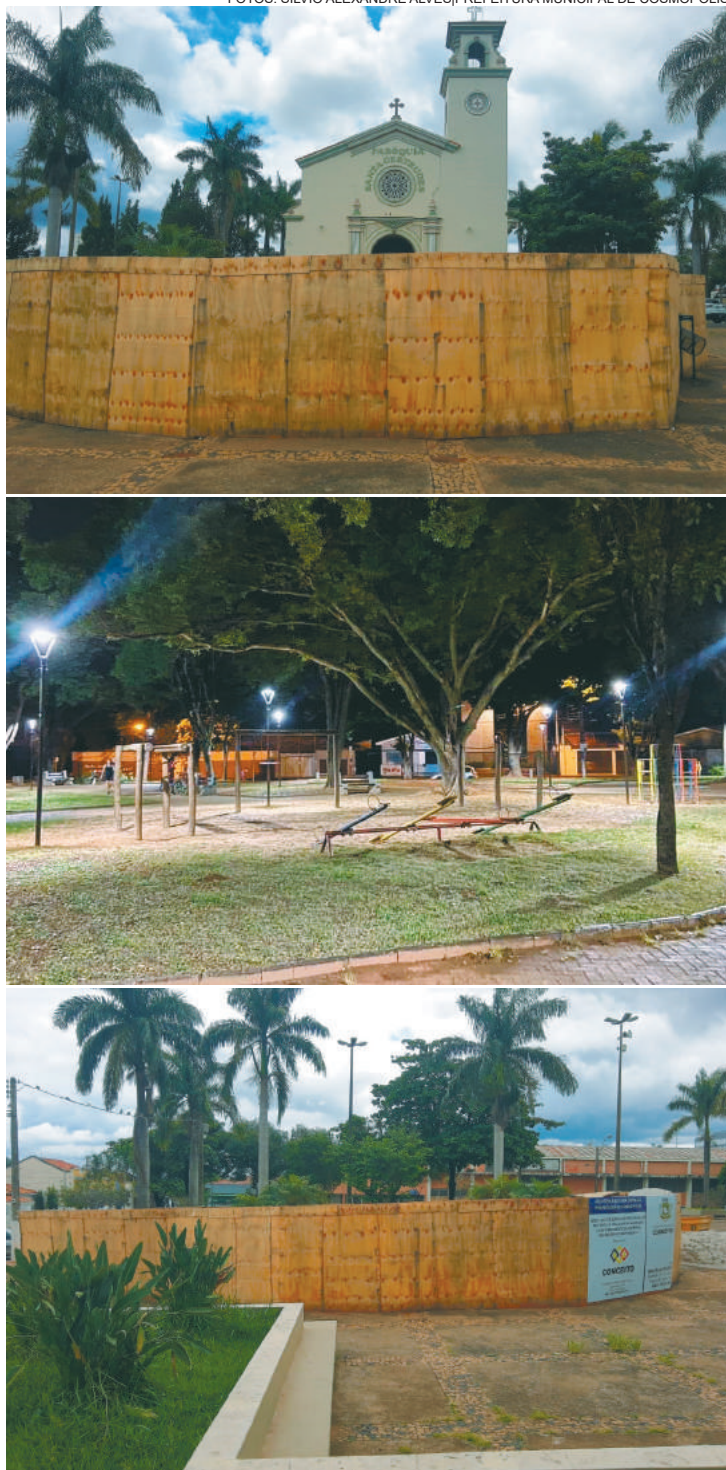
As praças públicas são patrimônio da comunidade; a maioria de nós cresceu brincando em uma

Outra praça que está passando por manutenção é a Praça Sérgio Rampazzo,