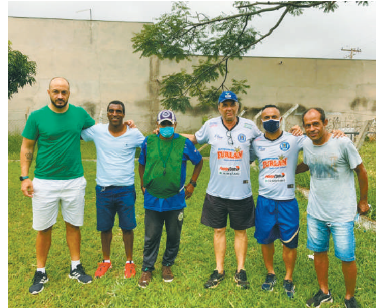
Os garotos que participaram do evento, em sua maioria, jogam na escolinha de futebol FutShow

meia... Mas acrescenta que se notarem bons jogadores, a posição não importa. Quando selecionado pela equipe de observação, o jogador terá 10 dias de testes no clube para ser avaliado com o grupo.