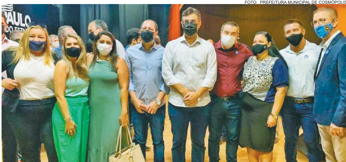
Futuro posto irá oferecer serviços presenciais e online

Unidade anunciada será integrada ao Detran e serviços da Prefeitura