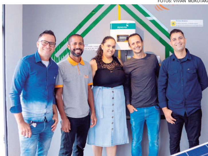
Equipe Modal Service pronta para prestar o melhor atendimento

O inversor é conectado à rede de internet, então, com um celular e o app, você consegue monitorar em tempo real.