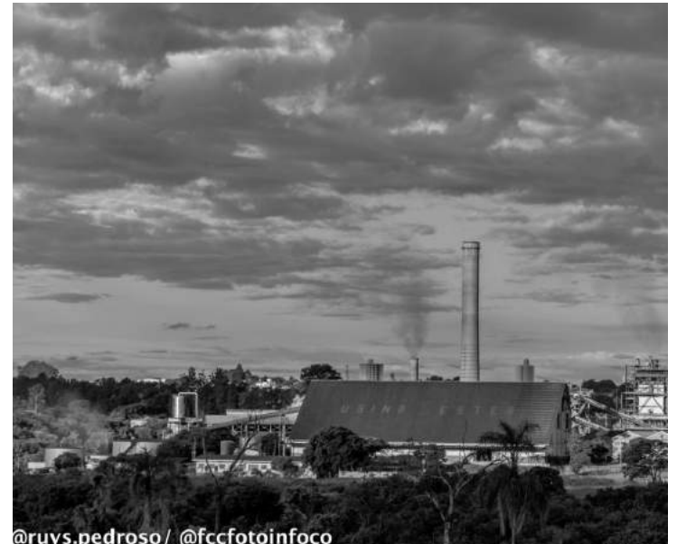
@ruys.pedroso / @fccfotoinfoco