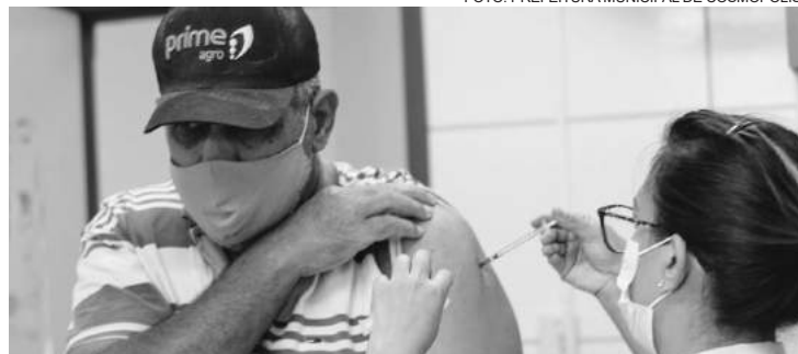
Para quem recebeu a vacina da Janssen, o reforço estará liberado com intervalo de dois meses

Ação estará sendo realizada em três unidades básicas de atendimento