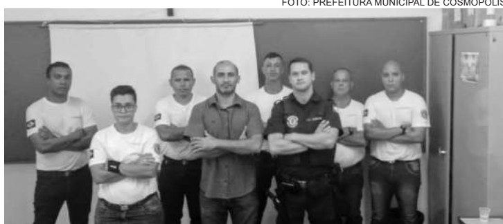
O conteúdo teve como abordagem as questões ambientais do município

O conteúdo teve como abordagem as questões ambientais do município. Foram abordados assuntos como ir-