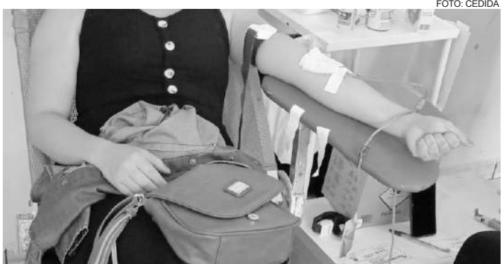
74 bolsas estavam aptas para a coleta

A próxima doação será no dia 25 de março