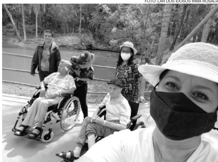
É importante também consumir legumes, frutas e verduras

Com o processo de envelhecimento, a quantidade de água do corpo dos idosos diminui. O mesmo ocorre com a sensação de sede. Ao juntar esses pontos com a maior exposição ao calor, sobe o risco de desidratação e perda de sais minerais. Por isso, é importante também consumir