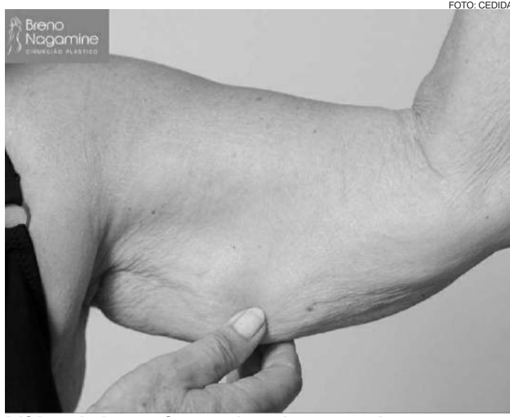
Lifting de braço é uma cirurgia para retirar o excesso de pele na região do "tchauzinho" do braço

Cirurgia das mamas, muitas vezes, com colocação de próteses. Na maioria das ve-