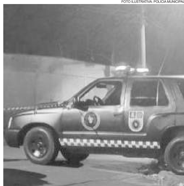
Indivíduos foram presos no Jardim do Sol