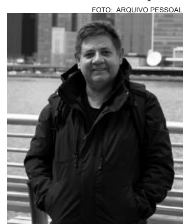
Ruy S. Pedroso Fotógrafo, Diretor de Cultura e Presidente do Fotocineclub Foto in Foco Instagram : @ruyzinhony @fccfotoinfoco Facebook: @ruys.pedorso

lhores fotos de cada aluno, será feita uma exposição fotográfica na Secretaria de Cultura para amigos e familiares dos estudantes e também para amantes de fotografia. Todos podem participar, iniciantes, amadores, profissionais etc. Idade mínima 15 anos. O Workshop será gratuito. Os interessados deverão fazer suas inscrições através do telefone (19) 3812-3101 ou pelo email cultura@cosmopolis.org.br ".