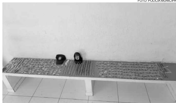
Grande quantidade de entorpecentes apreendida

EQUIPES: ROMU; G.O.C.; R.P. 18/17; Base Móvel; Motos; e Fiscalização de Trânsito