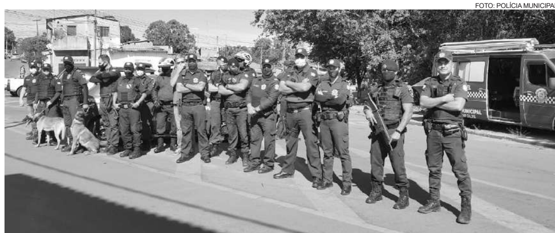
Equipes que participaram da operação

Materiais encontrados: Parque Ester: 137 unidades