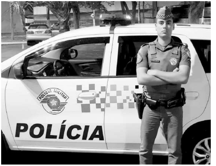
Ele atuou em Cosmópolis por 2 anos e 3 meses

Quando surgir a oportunidade, desejo fazer parte do