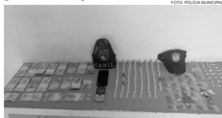
Foram apreendidas maconha, crack, cocaína e dinheiro

Eles são reincidentes e foram levados para a Fundação Casa