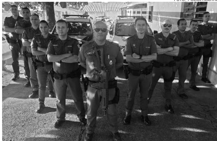
Equipe da Polícia Militar que participou da operação