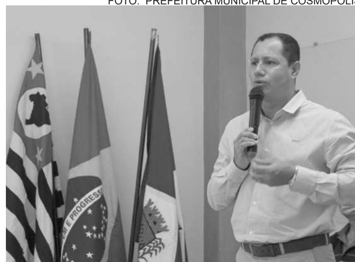
A intenção é reduzir o déficit habitacional da cidade

O link para inscrição é: https://cohabbandeirante.com.br/cadastrocosmopolis