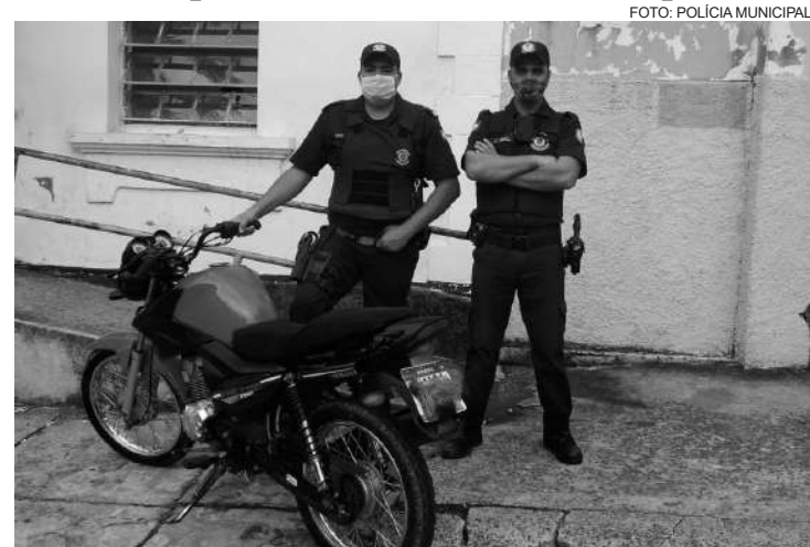
Veículo foi levado para delegacia e apreendido

Chassi também estava suprimido. Ele apresentou atitude suspeita diante da Polícia Municipal