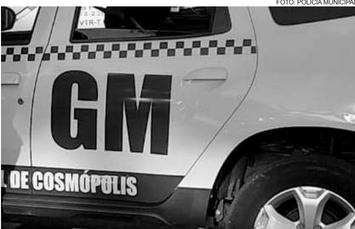
A tentativa de furto aconteceu na área central

VTR-18 - Enc.: GM 1° CE Calvi; Motorista: GM 3° CL Ferreira; Auxíliar: GM 3° CL Da Silva