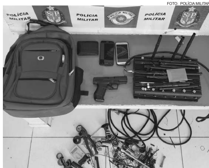
No interior do veículo, foi localizado o equipamento bloqueador de sinal conhecido como 'capetinha'

R$ 400 mil, com a carga de, aproximadamente, R$ 150 mil, foram recuperadas e entregues ao proprietário.