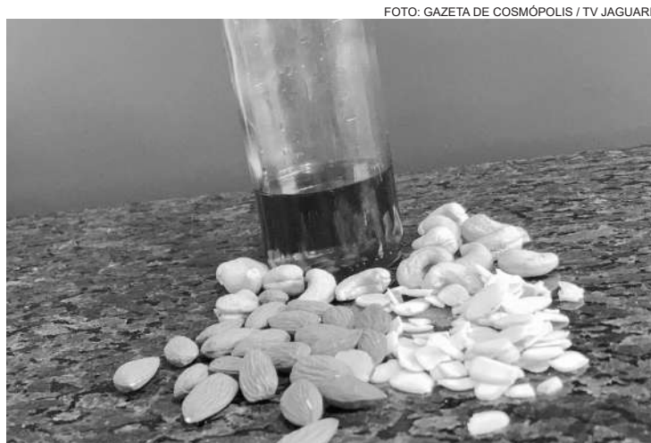
O azeite, assim como castanhas, são fontes de gorduras

Dica 2 - Na hora de escolher o seu azeite, opte sempre por pegar os vidros que ficam no fundo da prateleira e vidros escuros, ficando longe