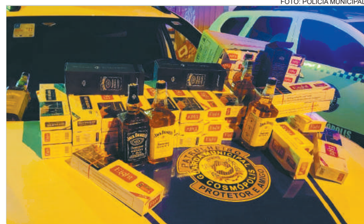
Ele foi abordado pela equipe da Polícia Municipal durante operação

Homem com cigarros e whisky falsificados é levado para a Delegacia Federal