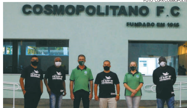
Ação fará parte do projeto "Mães da Favela"

Em parceria com CFC, CUFA doará 2 toneladas de alimentos para famílias carentes