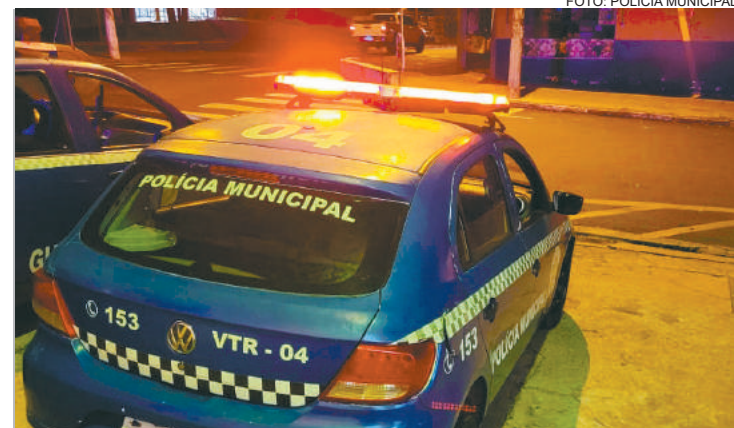
Indivíduo foi detido pelos seguranças do local até a chegada da Polícia Municipal

Pagou fiança de R$ 1.500,00 após furtar supermercado