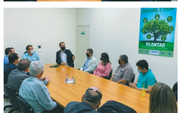
Os municípios envolvidos no projeto possuem uma população somada com cerca de 400 mil pessoas