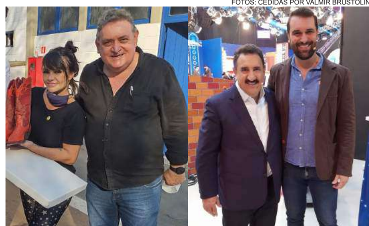
Em 2010, a empresa teve a primeira aparição no programa e participou do quadro 'Cortina Premiada'

Betel Avestruzes terá participação no 'Programa do Ratinho'