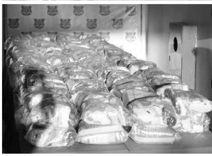
A distribuição começará neste sábado, dia 03 de julho