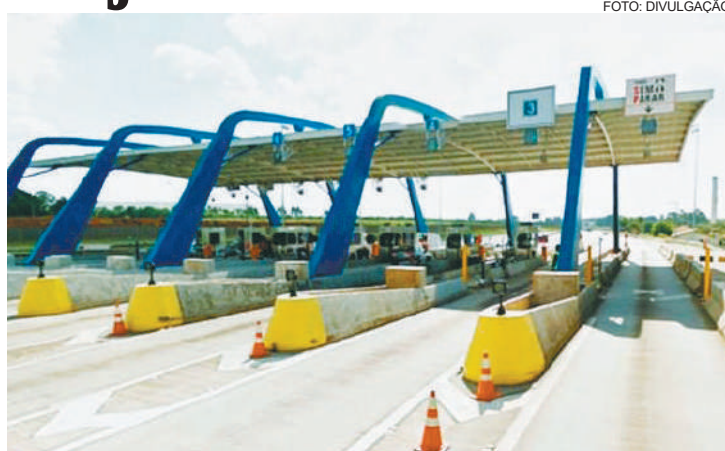
Valores passaram a ser R$ 9,50 para carro e R$ 4,75 para moto na praça Paulínia-Cosmópolis