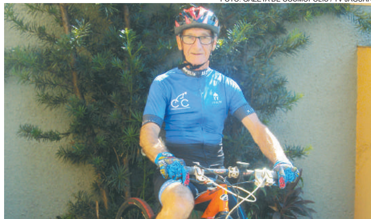
Multicampeão no ciclismo, o esportista sofreu um acidente na última sexta e, infelizmente, não resistiu