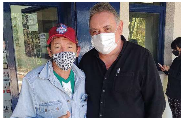
Momentos durante as gravações