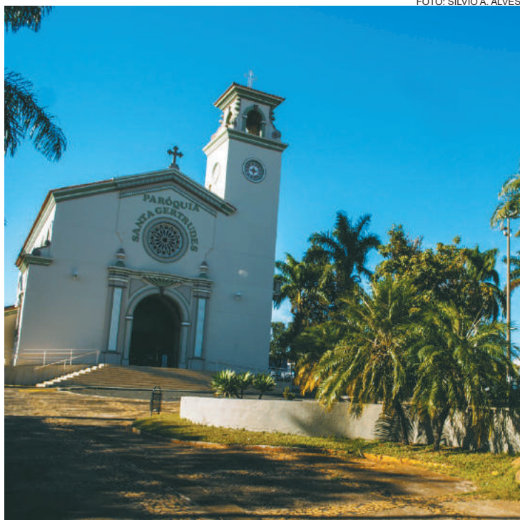
A construção da antiga matriz começou em 1905