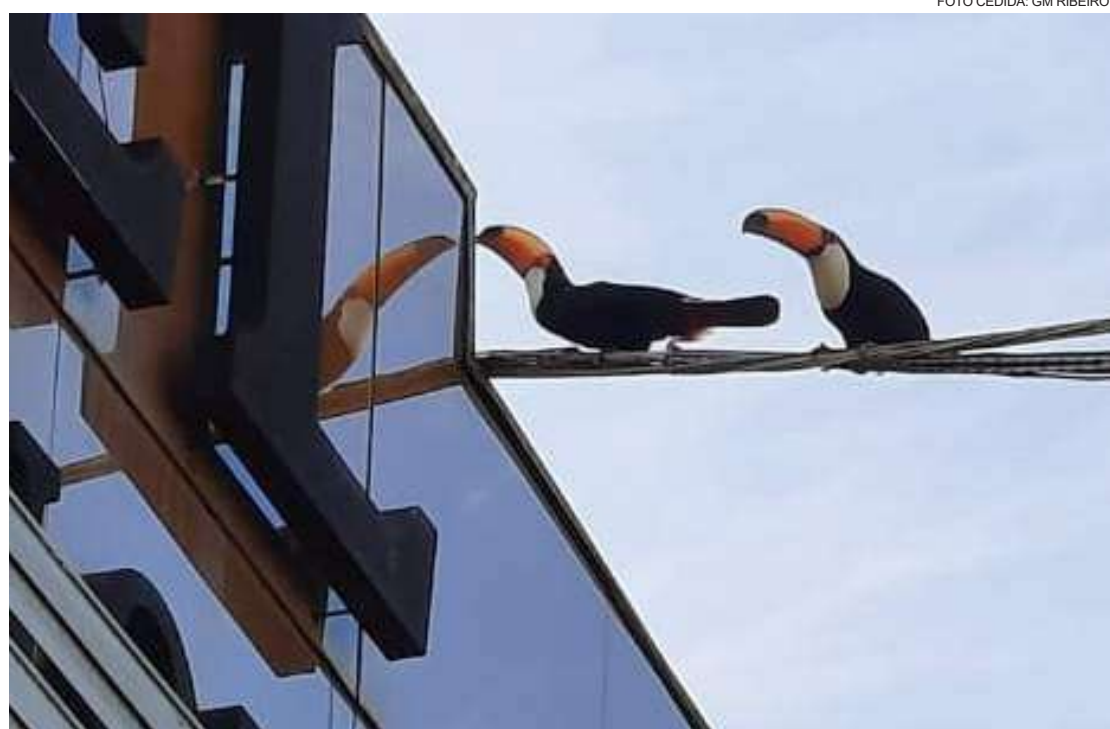
Tucanos encantados com a imagem refletida no espelho...

INTERNET FIBRA ÓPTICA PLANO 10 MEGA ILIMITADO COM BÔNUS DE NAVEGAÇÃO DE 100 MEGA R$ 89,90 mês