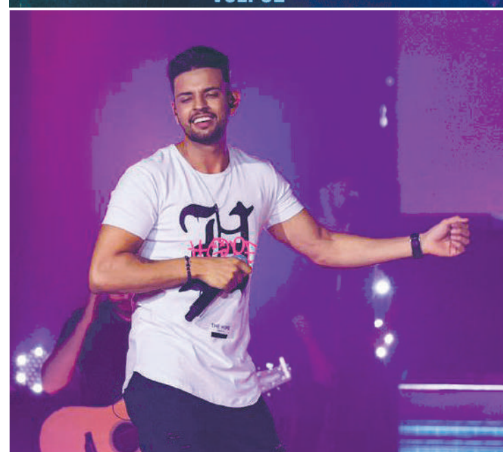
O lançamento é resultado de um trabalho de 20 meses

o que ocorrerá nas próximas gravações, diz 'Vini'.