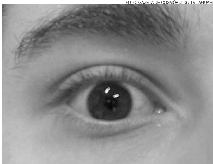
Doença tem gravidade variável, que vai desde o uso de óculos até a realização de transplante de córnea

Até meados dos anos 1990, o tratamento cirúrgico era exclusivamente o transplante de córnea. Entretanto, há cirurgias alternativas com diferentes