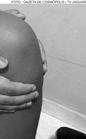
O derrame articular trata-se do acúmulo de líquido nas articulações da região do joelho

O tratamento deve ser orientado por um médico especializado.