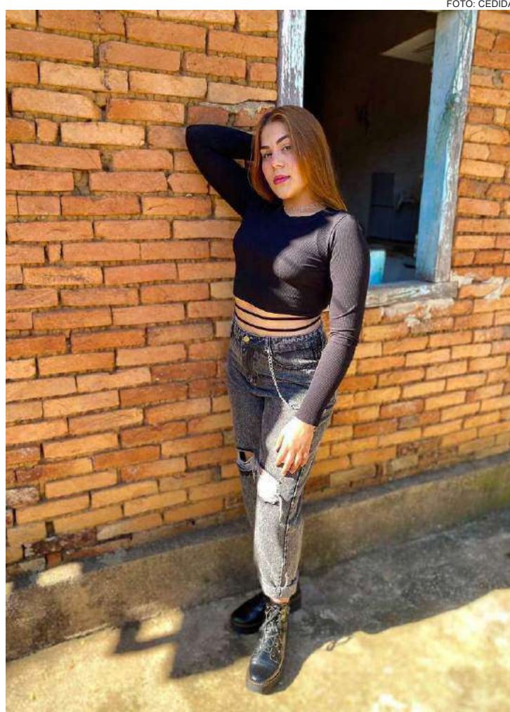
Mayza sonha em se tornar Digital Influencer

Deixe sua mensagem: Nunca desista dos seus sonhos.