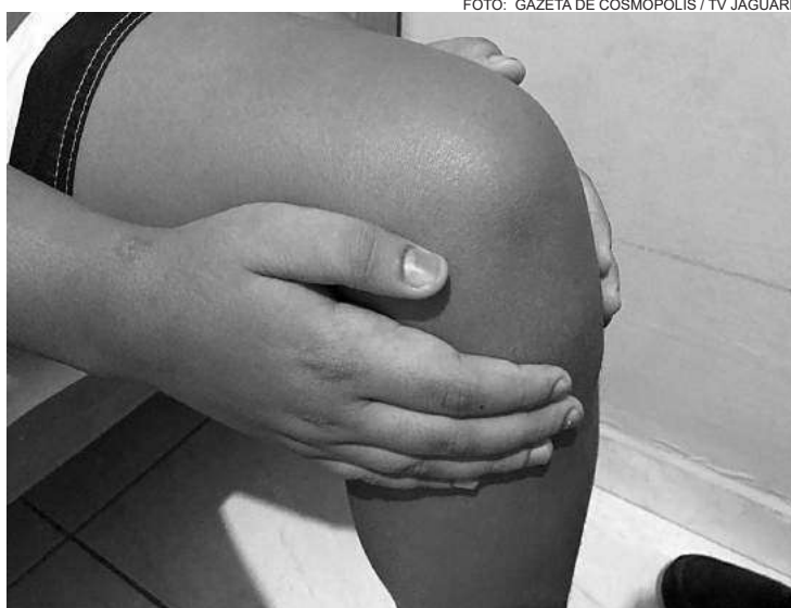
O derrame articular trata-se do acúmulo de líquido nas articulações da região do joelho

dos pés para o quadril é eficiente para aliviar a dor e o inchaço;