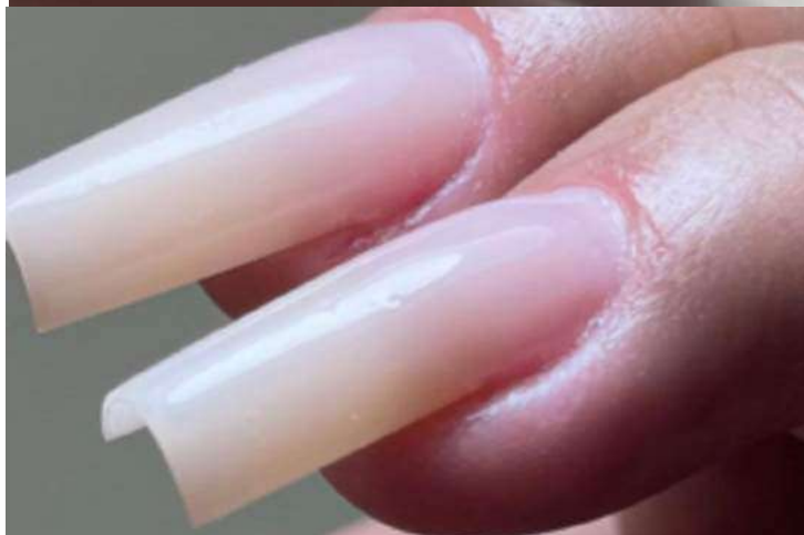
Fazer as unhas faz parte da rotina de muitas mulheres