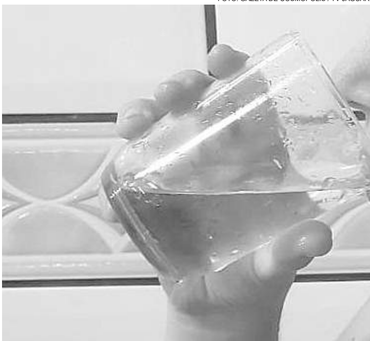
O sinal de sede já sinaliza uma desidratação

Pode ser que você esteja precisando de uma atenção maior para se hidratar! A necessidade de consumo hídrico, segundo a Ingestão Dietética de Referência (IDR) pode variar de acordo com vários fatores, como: sexo e idade do indivíduo, se pratica alguma atividade