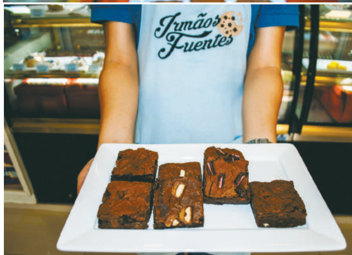
O cardápio deles é bem variado

e no Instagram, o endereço é @irmãosfuentes.cos