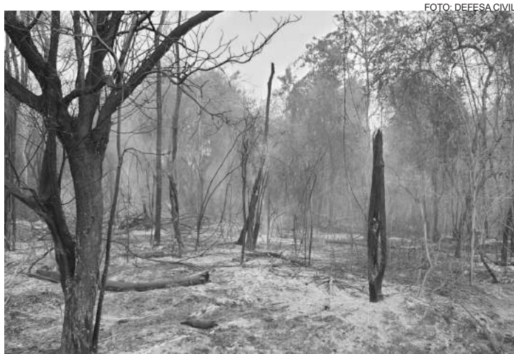
“Qualquer fiação é como uma pólvora”

A equipe de Cosmópolis também teve o apoio da Usina Ester