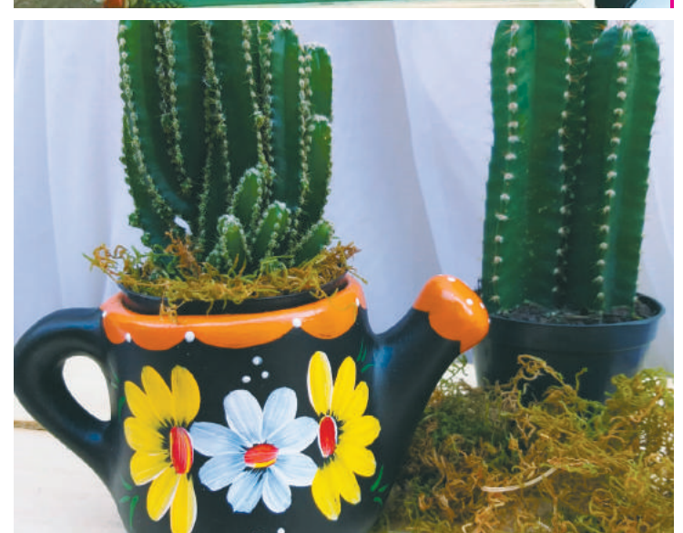
Ela começou no ramo pintando vasos