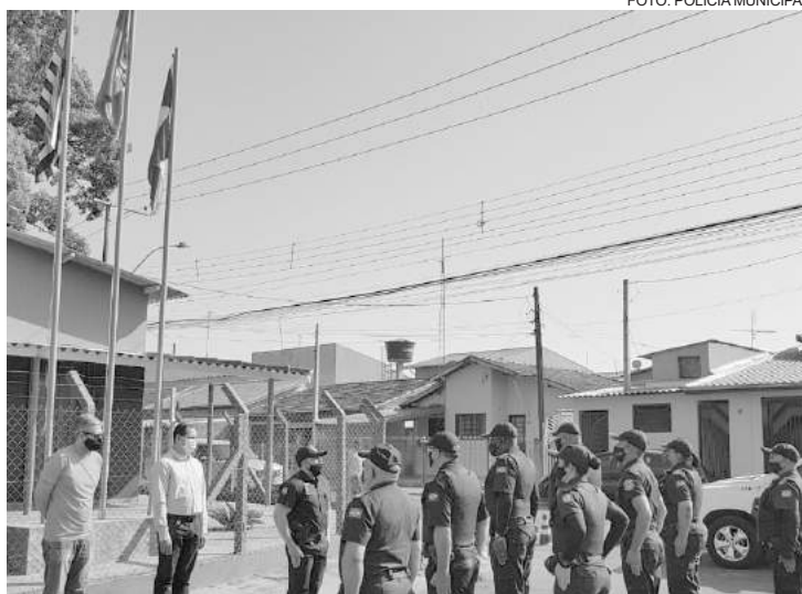
Efetivo que estava em serviço participou do evento

Devido a pandemia da COVID-19, o acesso foi limitado e não houve Desfile