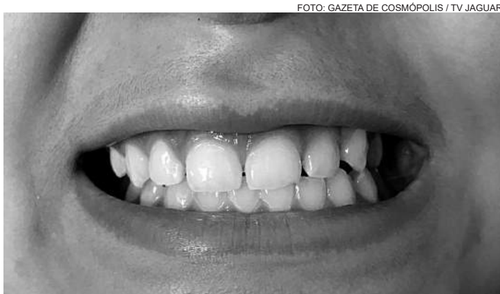
Os dentes vão escurecendo aos poucos com o passar do tempo

Efetuar tratamento dentário que permite branquear ou clarear os dentes