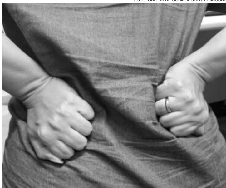
Um defeito genético também tem sido associado a estas doenças

Há também uma miopatia alcoólica aguda, mas, além da síndrome aguda, o álcool pode provocar uma miopatia mais crônica. Um defeito genético também tem sido associado a estas