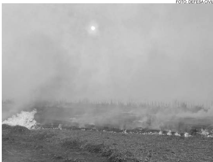
O fogo atingiu uma parte da área do Matão

A equipe teve um trabalho bem intenso e árduo para fazer o combate do fogo em toda extensão, com o apoio da Usina Ester e também do Cor-