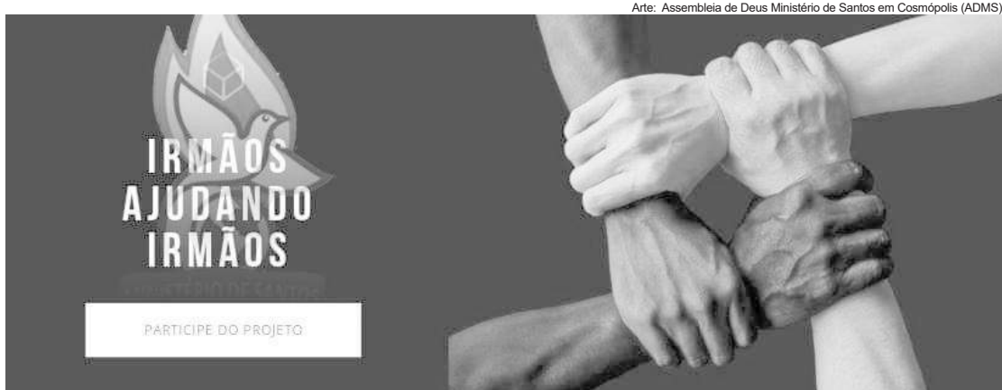
Arte: Assembleia de Deus Ministério de Santos em Cosmópolis (ADMS)

Uma das visões do projeto é apoiar o empreendedorismo entre os membros, por isso, a necessidade de ensinar sobre o tema segundo a Bíblia, bem como a parte técnica e os caminhos para a capacitação