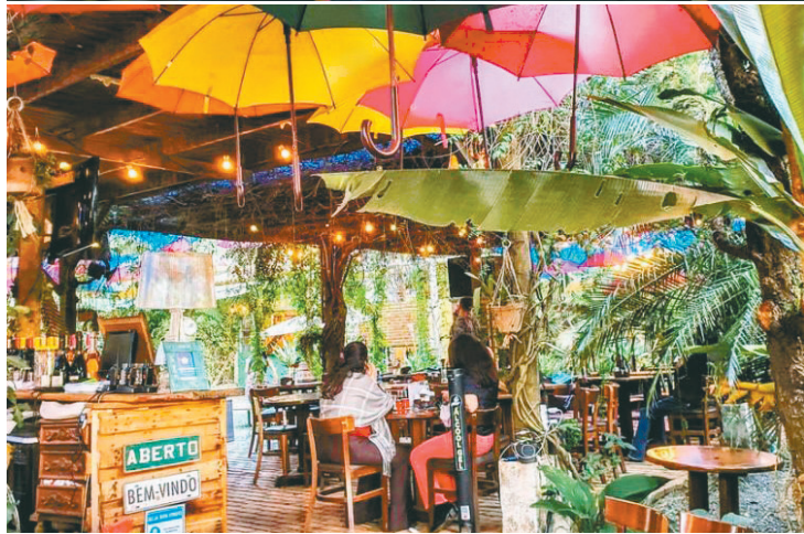
Restaurante com conceito de área rural

o restaurante em si, com um conceito de área rural, onde são oferecidas gastronomia brasileira, música brasileira de qualidade, em um espaço que valoriza a natureza.