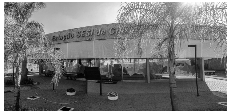
SESI Cosmópolis: para agendamento, ligue (19) 3872-1949

A Estação Sesi de Cultura de Cosmópolis (ESC) retoma os serviços ao público de forma parcial. O espaço já está em funcionamento de segunda a sexta-feira, das 10h às 16h, e o atendimento é feito mediante agendamento prévio.