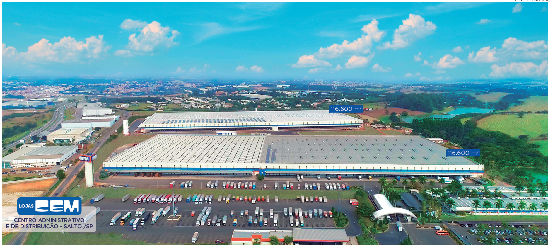
Centro Administrativo e de Distribuição das Lojas CEM: dois depósitos com 116.600 m² cada um

Mesmo assim, a rede manteve todos os seus