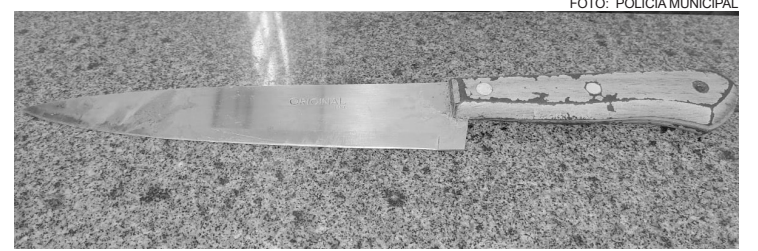
A moradora do local é ex-namorada da vítima e atual namorada do autor

Foi constatado que populares estavam pelo local tentando lavar o sangue deixado com mangueiras. De imediato, foi dada ordem de parada, pois, não se sabia se haveria necessidade de solicitar perícia no local. Os Policiais Municipais tentaram contato