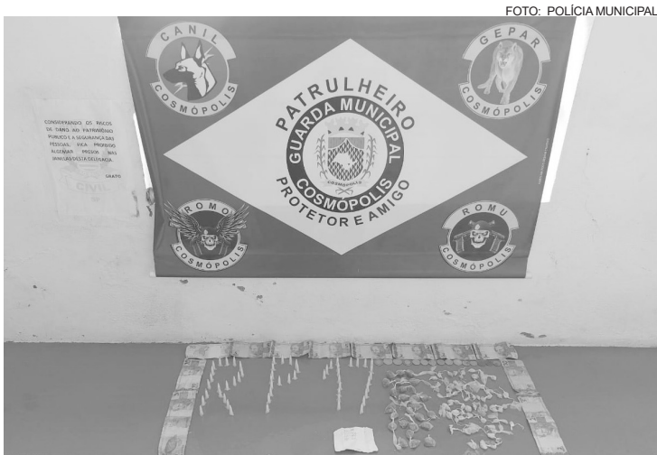
Dentro da sacola, também foram localizadas anotações sobre a venda dos entorpecentes no local

Foi realizada a incursão pela comunidade e, assim que o indivíduo avistou a viatura, empreendeu fuga pelo mato, não sendo possível alcançá-lo. Foi feita a pro-