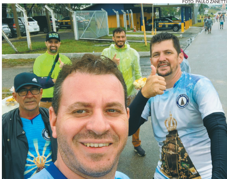
"Cada história ouvida carrega um milagre, uma bênção ou uma meta"

"[...] Me comprometi a fazê-la anualmente, somente por fé e devoção, sempre agradecendo e levando todas as intenções de amigos ou pessoas que precisam"