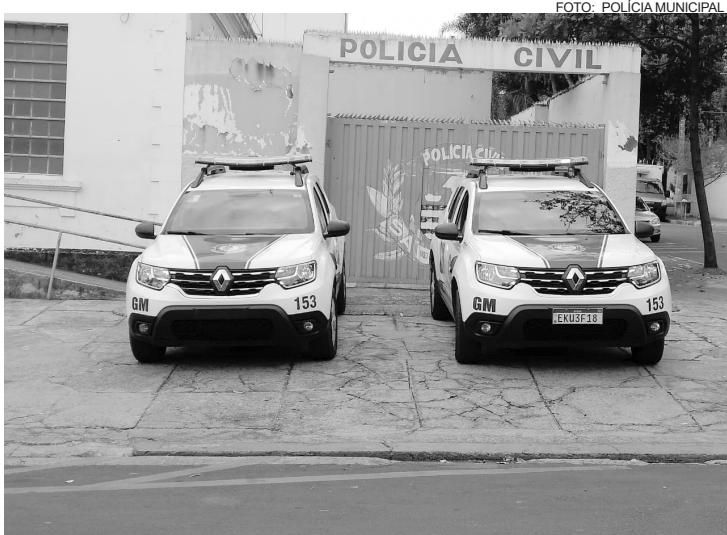
Indivíduo permaneceu à disposição da justiça

Com as informações das características do indivíduo,