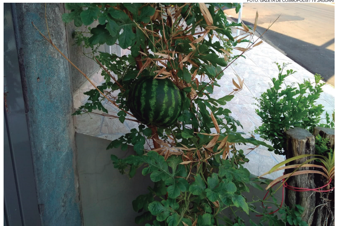
Morador adapta bambu para apoiar a melancia para fruto não cair no chão

INTERNET FIBRA ÓPTICA PLANO 10 MEGA ILIMITADO COM BÔNUS DE NAVEGAÇÃO DE 100 MEGA R$ 89,90 mês