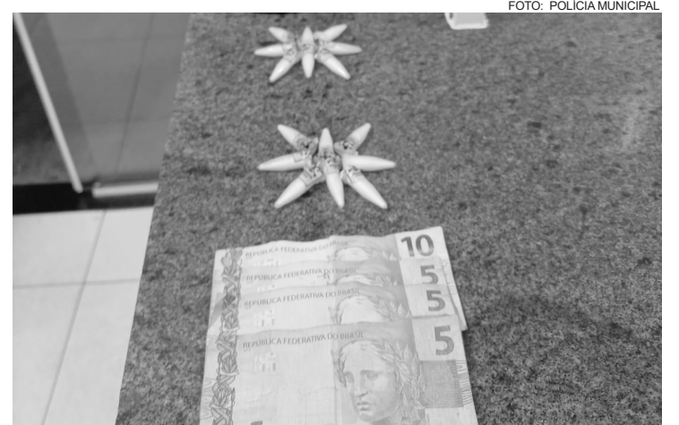
Foram apreendidos 16 microtubos de substância branca, aparentando ser cocaína; e R$ 25,00 em notas diversas

As equipes encontravam-se em patrulhamento pelas vias públicas, quando, ao longo da via, foi avistado um veículo parado sinalizando. No ato, um indivíduo foi até um Uno que estava estacionado à direita e pegou, embaixo do pára-choque, algum objeto e entregou para o indivíduo no veículo, não sendo possível abordar o veículo. Foi abordado o indivíduo na via e, realizando busca pessoal, foram encontrados R$ 25,00 e um microtubo de cocaína.