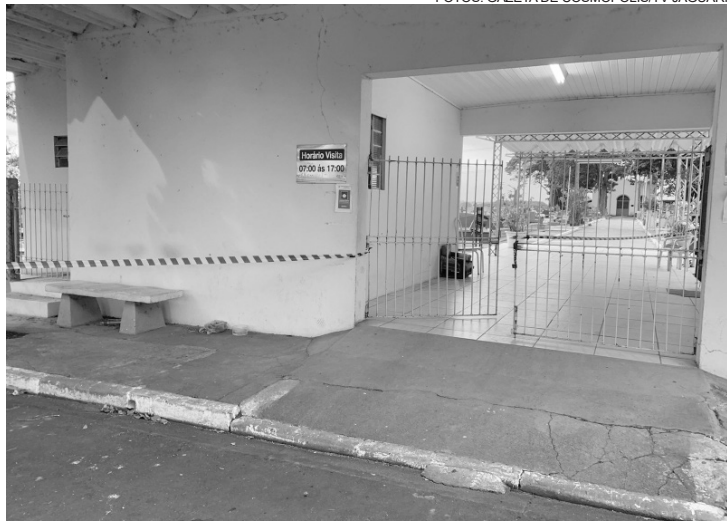
No momento dos disparos, havia várias pessoas no Velório Municipal, onde um corpo era velado

Por volta das 15h30, o ajudante encontrava-se sentado no banco juntamente com uma testemunha e, de repente, surgiu uma motoci-