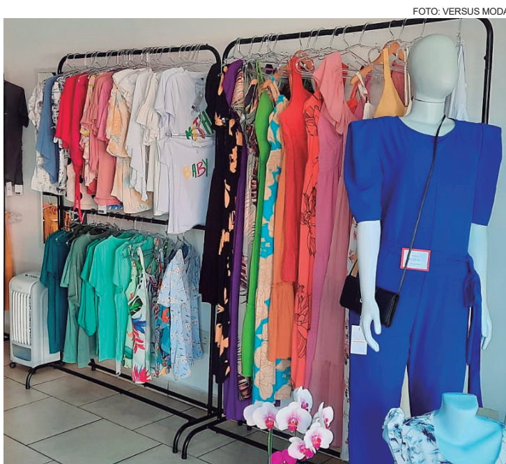
Venha conhecer essa mais nova opção em moda

de presentear. O vale-presente é uma ótima sugestão para o privilegiado escolher seu próprio presente.