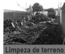
Aterro e nivelamento de terreno