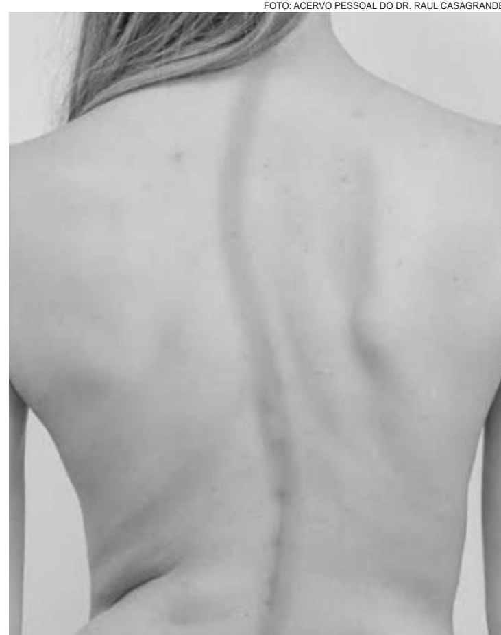
Os pacientes podem retomar gradativamente suas atividades após a consolidação da cirurgia

cipalmente, de dois fatores: o valor angular da curva (tamanho da curva) e a maturidade esquelética do paciente (quanto de crescimento ainda é esperado). Em geral, quanto maior o valor angular da curva e menor a maturidade esquelética do paciente, mais provável é a progressão da escoliose. Existem basicamente três opções de tratamento: Observação, Orteses (coletes) e Cirurgia.