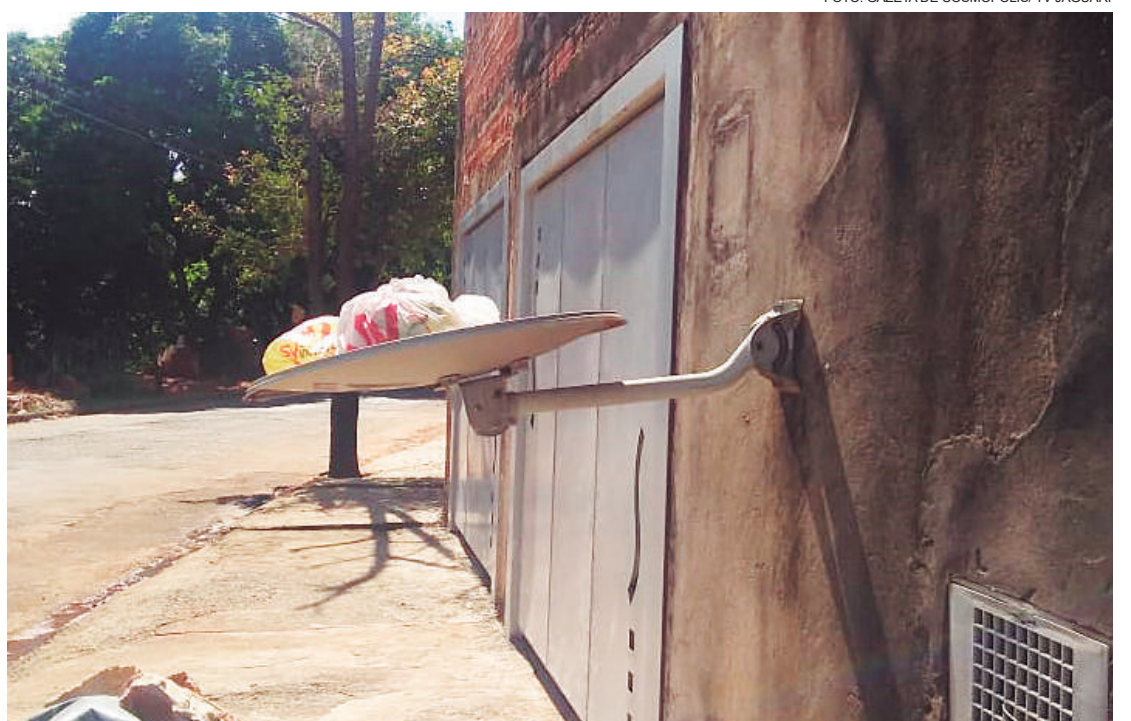
Criatividade para reaproveitamento: morador da Rua Jaguariúna fez uma adaptação com uma antena parabólica, reciclando e usando como lixeira