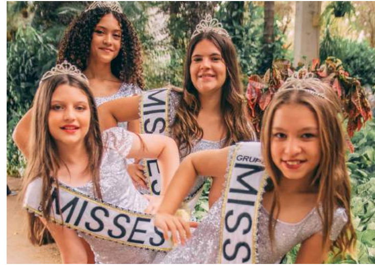
Grupo traz uma nova proposta com músicas atuais voltadas ao público infantil e adolescente