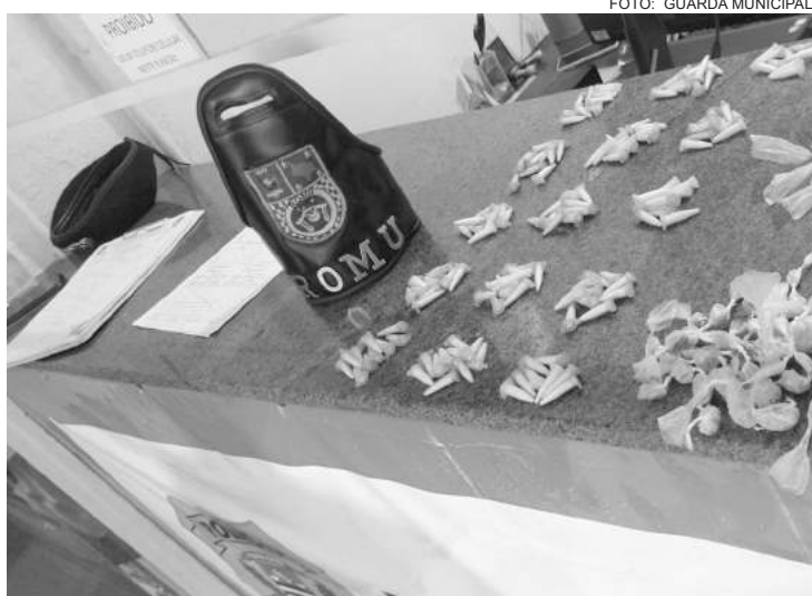
Os materiais ficaram à disposição da justiça

A equipe de ROMU, durante patrulhamento pelas vias públicas da cidade, realizou buscas pelo perímetro das vielas onde é realizada a venda de entorpecentes e logrou êxito em encontrar uma sacola verde na areia. Foram apreendidas 148 porções de cocaína; 48 porções de crack; e 38 porções de maconha.