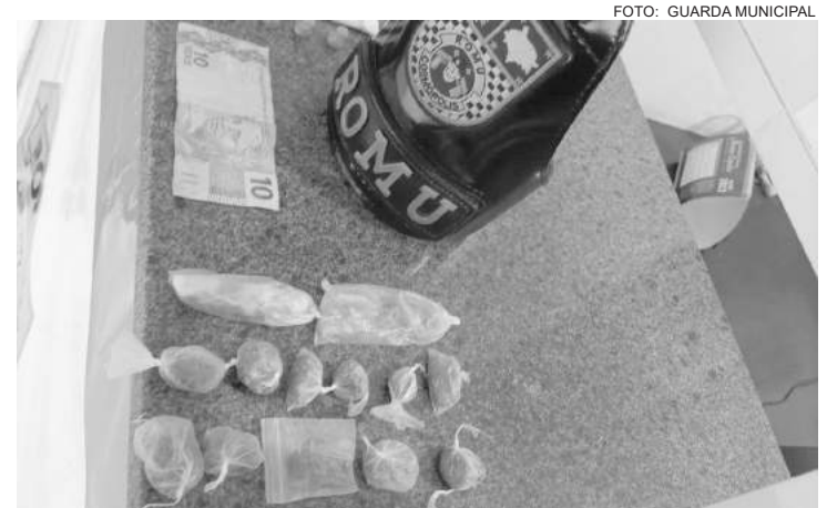
Também foram encontrados R$38,00 em moedas e cédulas

Questionados, o segundo informou ser usuário e que estava comprando uma porção de ma-