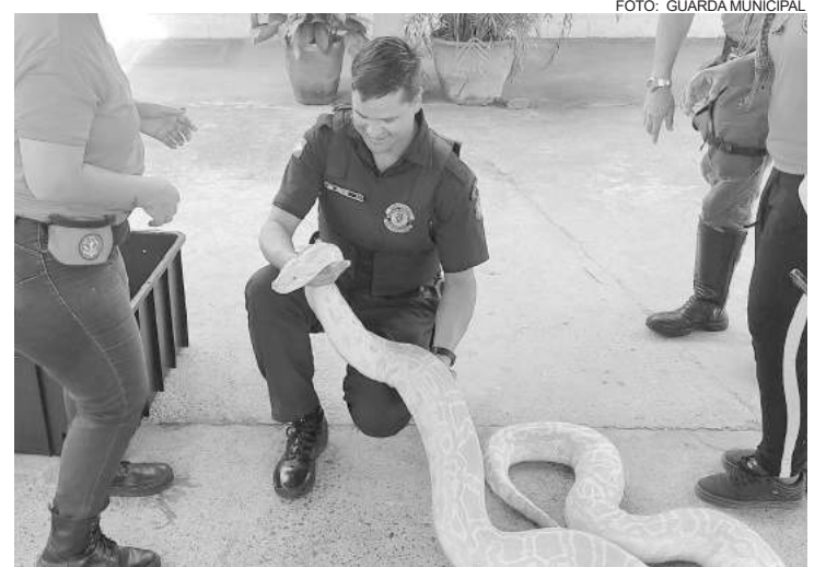
O GM volta com o compromisso de ser multiplicador do conhecimento adquirido”

Cosmópolis não mede esforços para capacitar cada vez mais seus policiais. O GM volta com o compromisso de ser multipli-