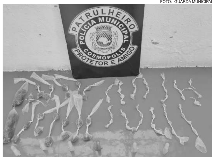
O jovem possui 26 anos e a adolescente, 15

Em revista na adolescente, foram localizadas, na altura dos seios, 24 pedras de crack e uma trouxinha de maconha no bolso da bermuda.