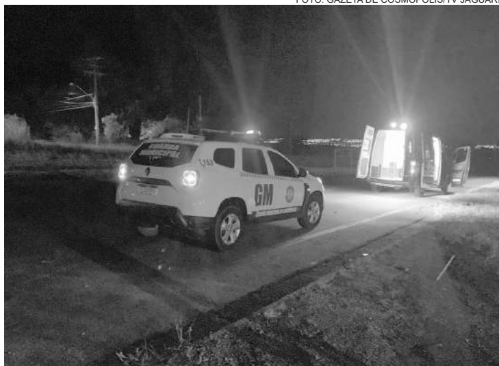
A Guarda Municipal foi acionada e fez o resguardo e a sinalização do local até a chegada da Polícia Rodoviária

A Guarda Municipal foi acionada e fez o resguardo e a sinalização do local até a chegada da Polícia Rodoviária.