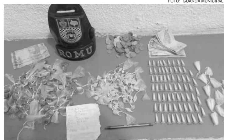
Suspeito segurava uma sacola com as drogas

A equipe de ROMU, em conduta de patrulhamento pelas vias públicas da cidade, realizou uma incursão pelas vielas, onde os GMS avistaram 04 indivíduos, sendo que um deles estava segurando uma sacola plástica, contendo 88 porções de cocaína; 86 porções de crack; e 96 porções de maconha. Já um segundo indivíduo estava segurando os valores em dinheiro, em espécie e moedas, no total de R$ 137,60. Um terceiro