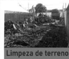
Aterro e nivelamento de terreno