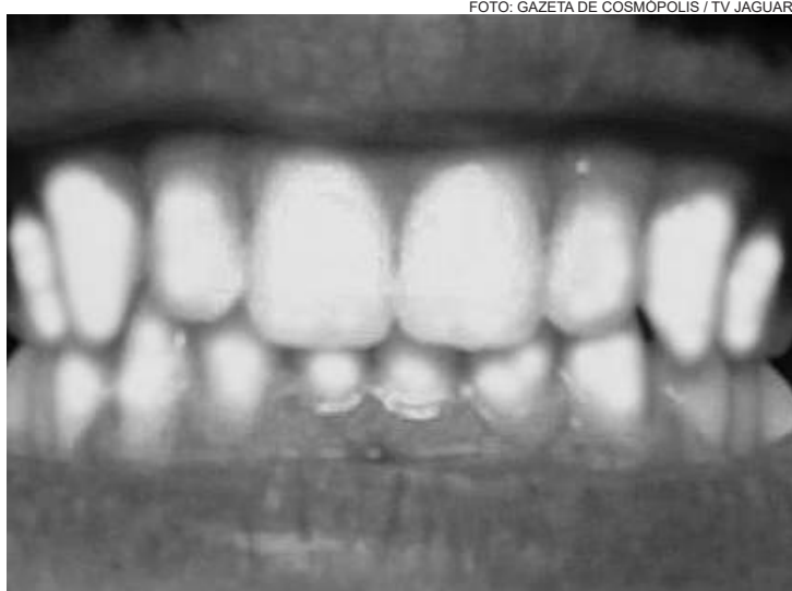
O siso é um dente como os outros. Deve ser higienizado corretamente

“Nem todos os pacientes têm os 4 dentes do siso. Podemos diagnosticar a presença de 1 até 4. Em alguns pacientes, verificamos a ausência total deles, que são casos raros”