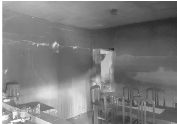
Cômodos ficaram deteriorados e estrutura do imóvel ficou comprometida

Na tarde de sexta-feira (06), por volta das 15h, a Guarda Municipal (GM), através da equipe de Gepar, atendeu um chamado de furto seguido de incêndio na Rua Januário da Silva Ferreira, no Uirapuru.