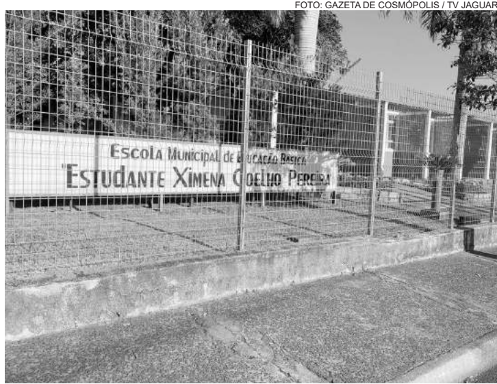
No portão da escola foi afixado um comunicado sobre o fechamento

Prefeitura Municipal de Cosmópolis emitiu um comunicado