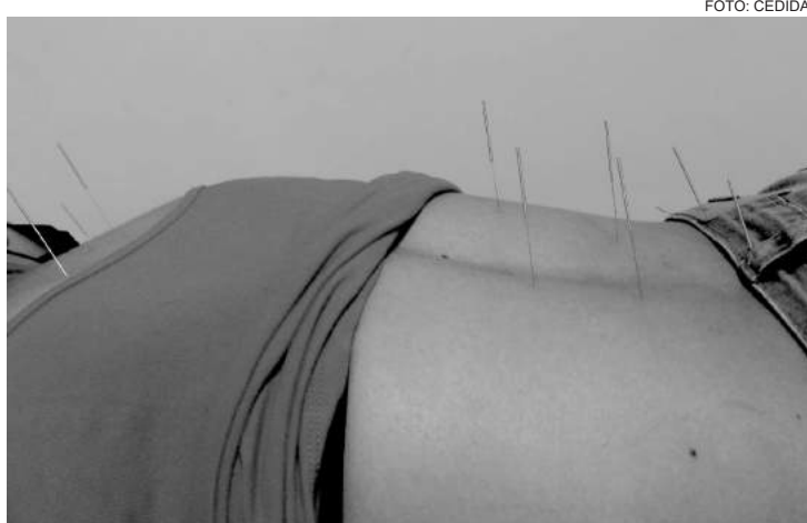
Estudos já comprovaram que a Acupuntura tem uma eficácia de até 80% no tratamento da enxaqueca

Existem diversos tipos e várias causas de dor de cabeça