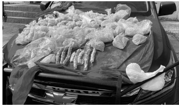
A Operação Farda Azul foi realizada na quarta, dia 10