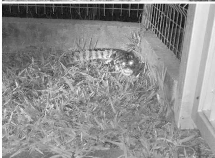
Caso encontre qualquer animal fora de seu habitat, chame a equipe da Defesa Civil. Ligue 153

Na madrugada de terça-feira (11), por volta de 22h, a equipe de Proteção e Defesa Civil fez o resgate de um filhote de jacaré que se encontrava próximo ao alambrado de uma indústria farmacêutica, instalada às margens da Rodovia SP 332, no bairro Itapavussu.