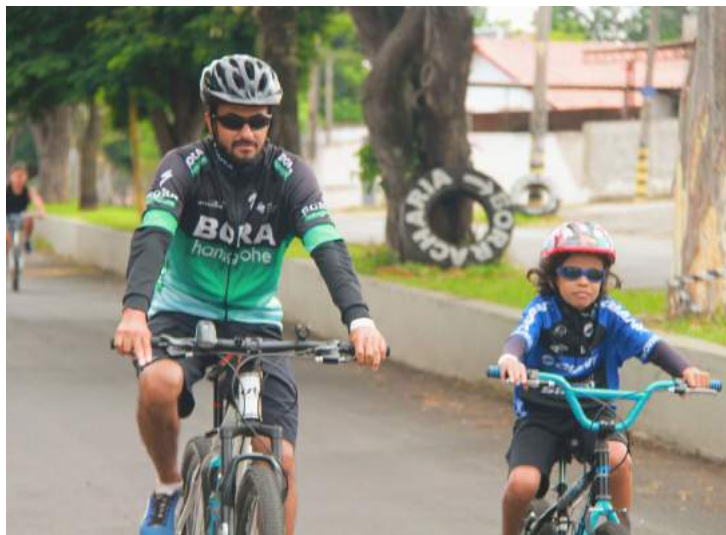
Se puder, doe 1 kg de alimento

garantir a segurança de todos. Se puder, doe 1 kg de alimento; os alimentos doados serão destinados a entidades locais.