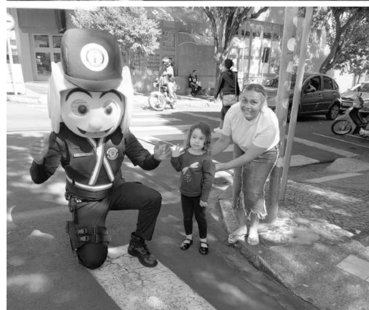
Personagem Aptonildo está sempre em alerta para conscientização e educação para o trânsito