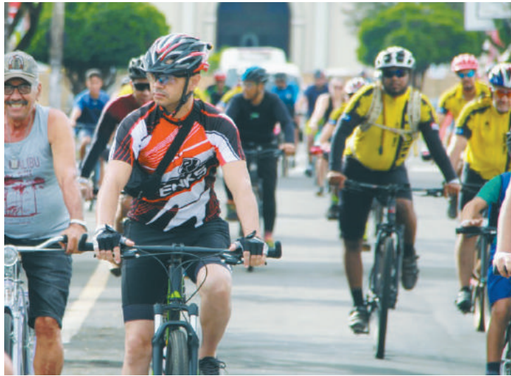
ARTE: SECRETARIA DE COMUNICAÇÃO DA PREFEITURA MUNICIPAL

Durante todo o percurso, haverá acompanhamento de carro de som para animar o pessoal e carro de apoio, para