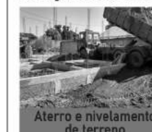
Aterro e nivelamento de terreno

Locação de máquinas: Retro escavadeira, Mini Pá Carregadeira, Escavadeira Hidráulica, mini escavadeira hidráulica, Pá Carregadeira. Locação de caminhão: Caminhão Basculante, Rollon Rollôf