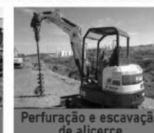
Perfuração e escavação de alçerce