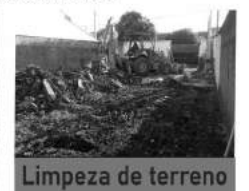
Limpeza de terreno