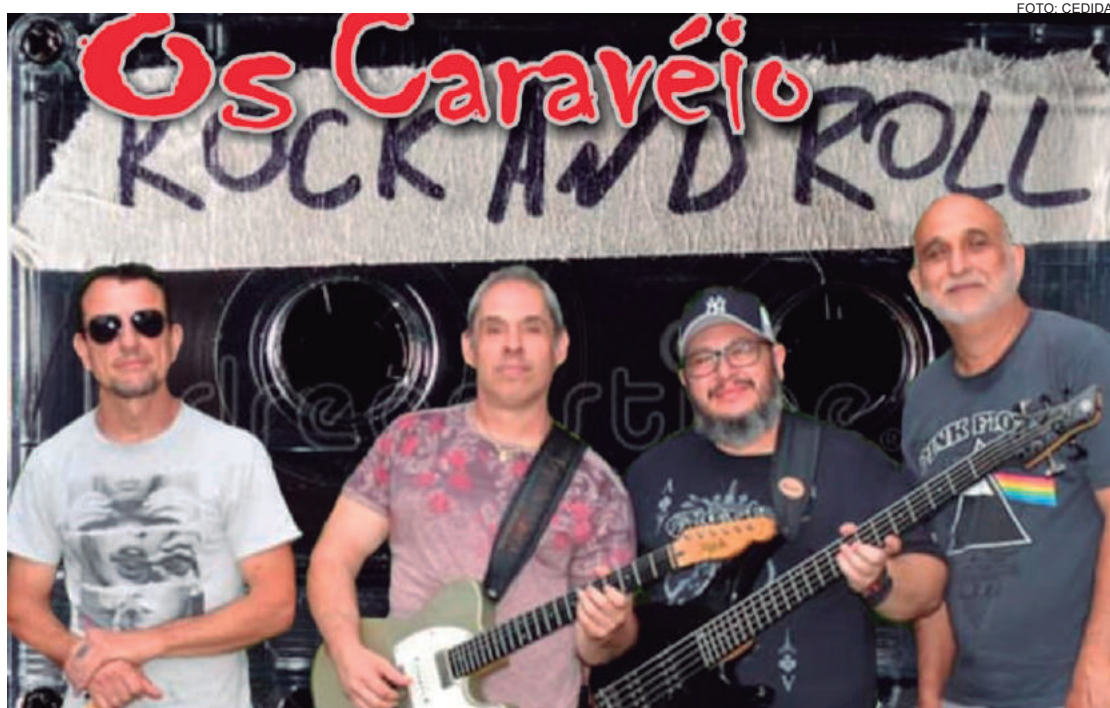
Amigos que desde há muito tempo buscam na música um refúgio

Banda é formada por velhos de guerra dentro do mundo da música que até hoje se encantam e cantam o rock a plenos pulmões