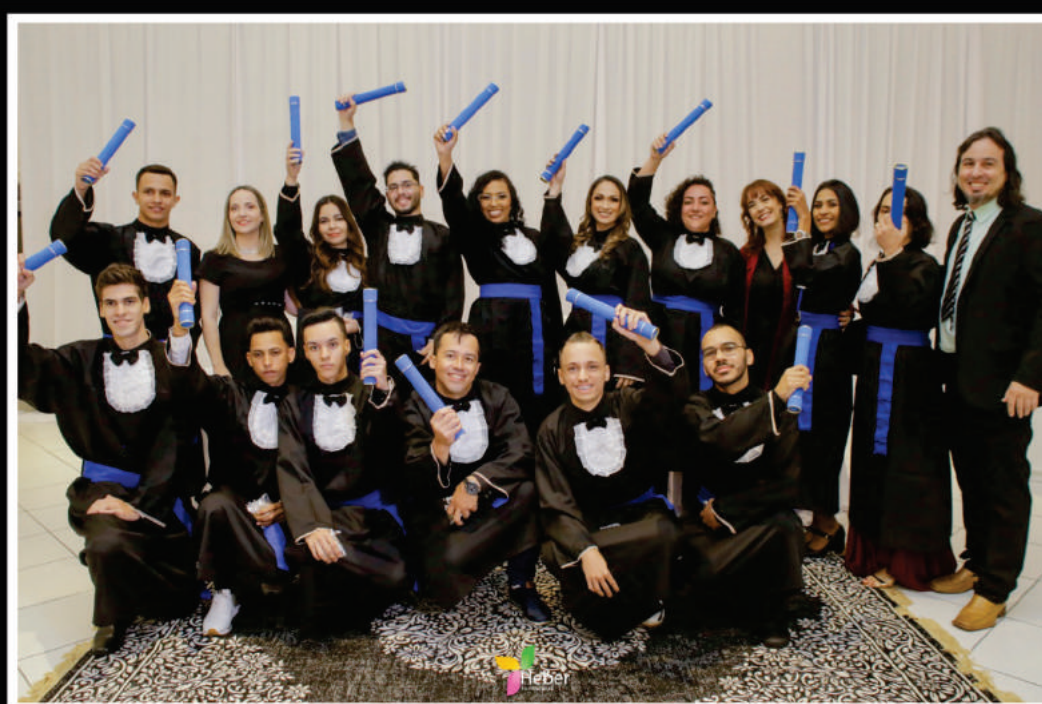
Na sexta-feira (01), aconteceu a Colação de Grau dos formandos do curso de Técnico em Química do Meu Colégio! Parabéns a todos!!