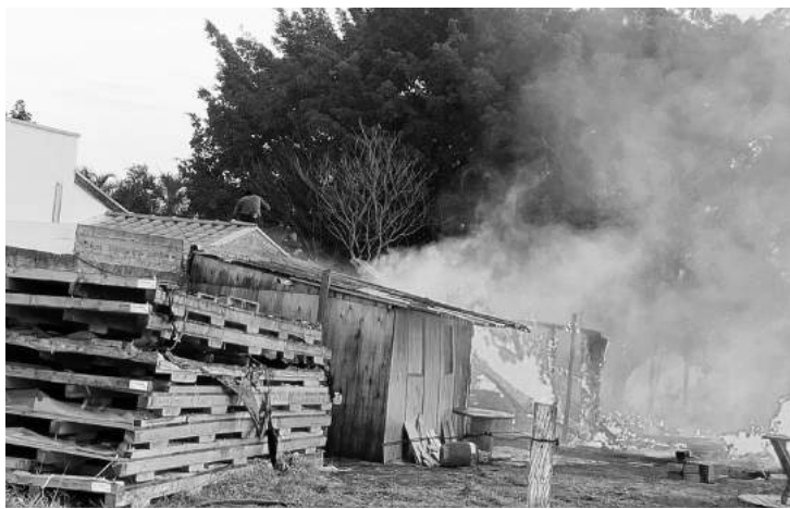
Foram várias horas de trabalho intenso

Na tarde de quarta-feira (03), por volta de 16h, a equipe de Proteção e Defesa Civil foi acionada para combater um incêndio de grande proporção, que destruiu materiais armazenados em um terreno localizado nos fundos do clube desativado Águas Lindas, no bairro Campos Salles.