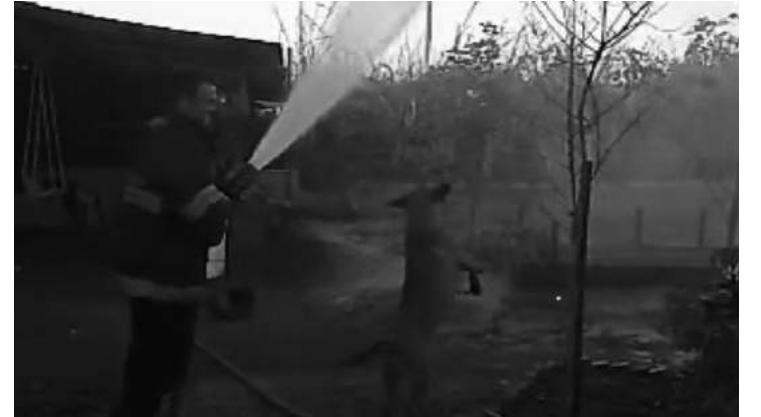
Quando a Defesa Civil chegou ao local para combater fogo, o cachorro começou a brincar com a água

Na tarde de segunda-feira (02), um cachorro chamou a atenção durante o trabalho da equipe da Defesa Civil no combate a um incêndio, próximo da Escola Alemã.