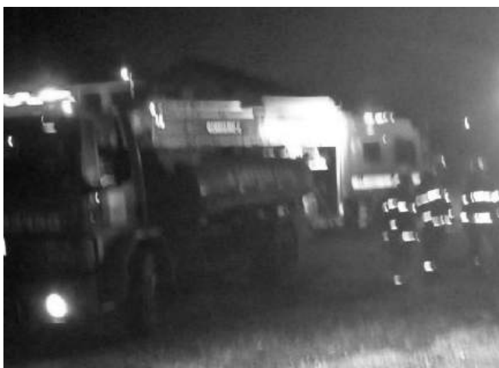
Não houve feridos

"Foram 5 horas de trabalho árduo e intenso, mobilizan-