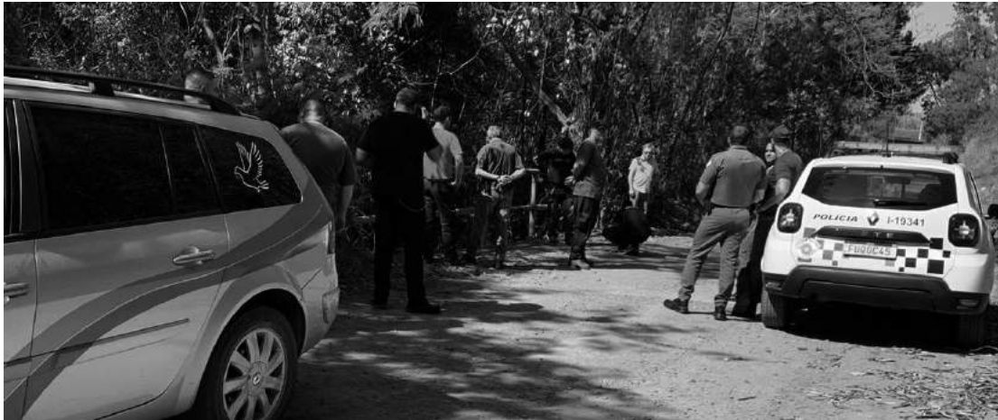
O corpo foi recolhido pela Funerária local

Ele apresentava ferimentos compatíveis com facadas