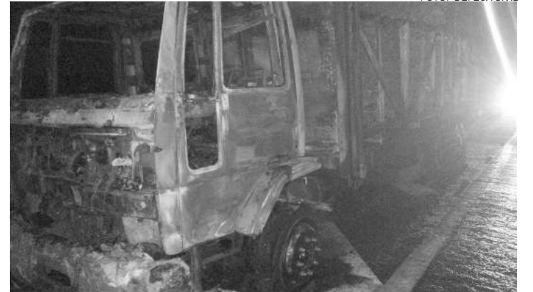
No km 149 da rodovia Prof. Zeferino Vaz (SP-332)

Na noite de quarta-feira (03), um caminhão modelo Ford/Cargo pegou fogo na Rodovia Professor Zeferino Vaz, a SP 332, no km 149, próximo da balança de pesagem, em trecho que pertence à cidade de Artur Nogueira.