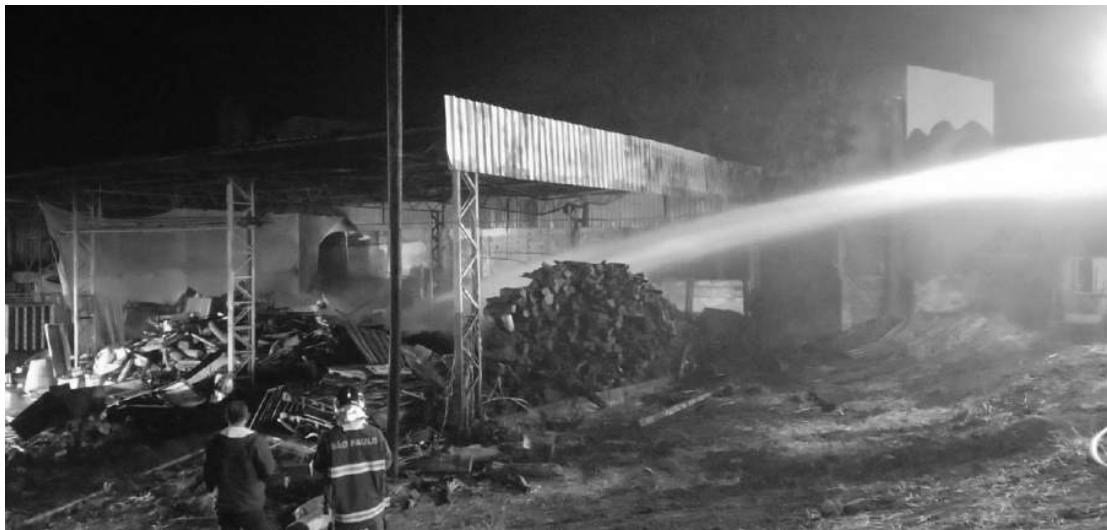
Galpão armazenava materiais diversos

Uma máquina foi utilizada para revirar o material, eliminar os focos e evitar uma nova propagação