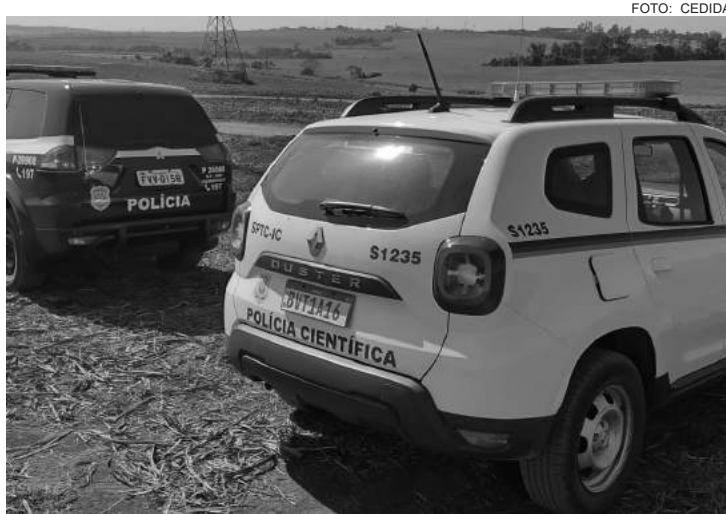
O corpo foi recolhido pela funerária

A equipe da Polícia Científica esteve no local e, após perícia, foi constatado que havia