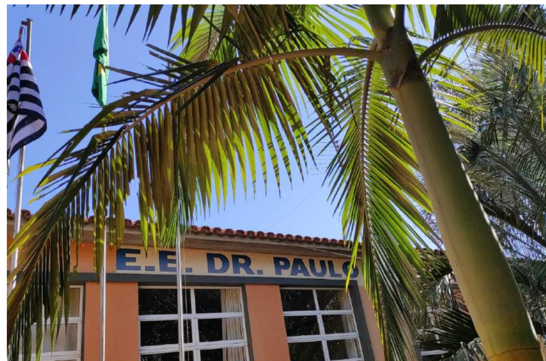
Escola Estadual Dr. Paulo de Almeida Nogueira (Gegan) tem 65 anos

Quem de nós não se lembra daquele professor marcante, que admirávamos e servia de exemplo para nós? Se pensarmos neles, conseguimos lembrar até das roupas que usavam. Conquistar essa geração é, com certeza, nosso maior desafio!", conclui.