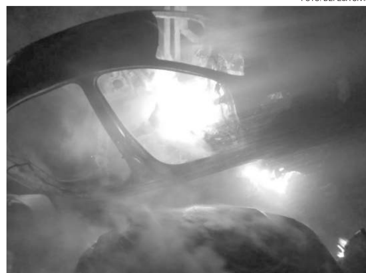
Primeiro atearam fogo no mato e depois nos carros

Denúncias podem ser feitas pelo 193 ou pelo 3872 2600, que também é WhatsApp