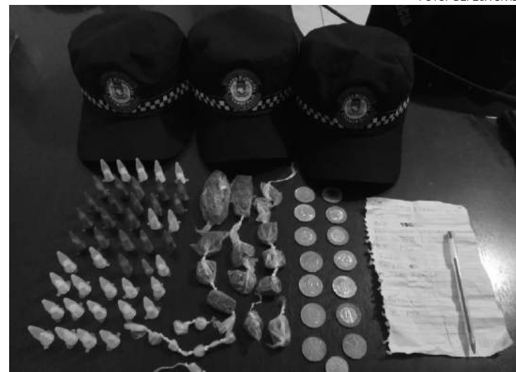
Adolescente foi detido e depois liberado

Todo o material foi apresentado no Plantão Policial para elaboração do Boletim