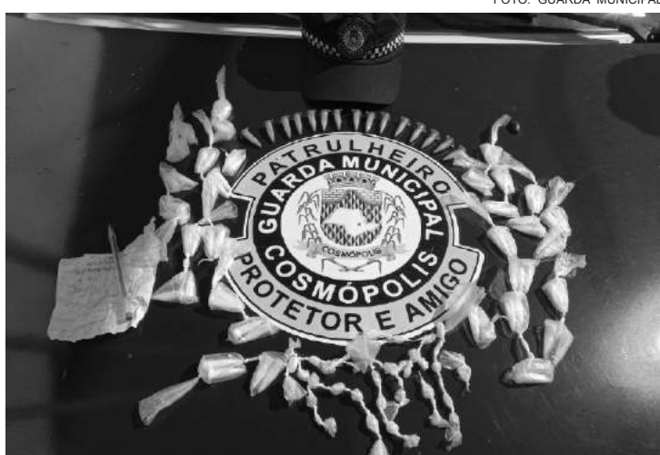
Foram encontrados cocaína e crack

Foram apreendidos os seguintes entorpecentes: 79 porções de cocaína; 34 porções de