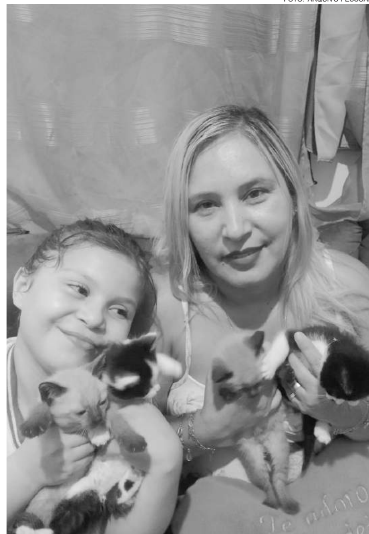
"São os amigos da gente pra toda hora"

Quando você viaja, você leva os seus xodós ou os deixa com alguém?