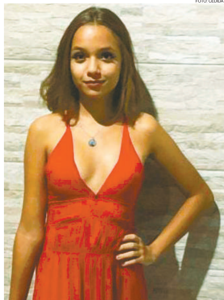
Profissão dos sonhos é a Medicina Veterinária