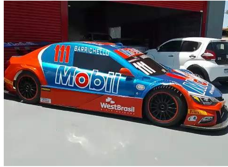
Réplica do carro da Mobil da Stock Car exposta

O alinhamento e balanceamento, novidades no atendimento, são feitos em 3D com equipamentos de última geração. É mais uma novidade