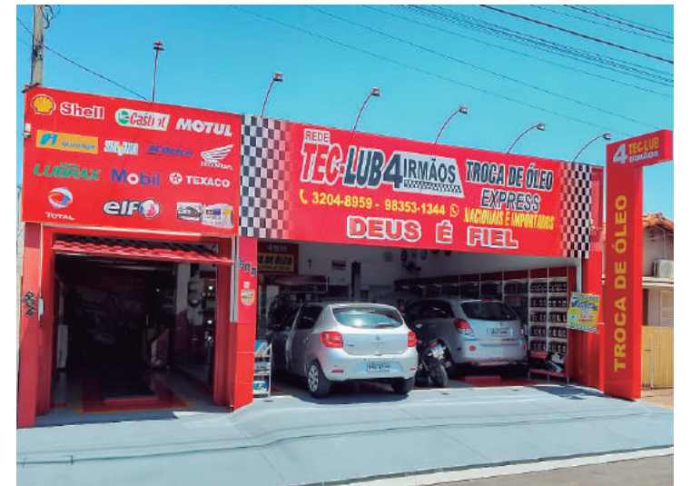
Primeira loja da TecLub Express 4 Irmãos

Empresa gera 15 empregos dentro da cidade