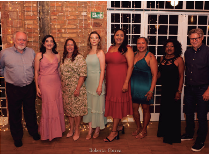
Equipe de Funcionários