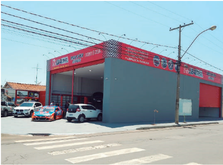
Nova loja na rua Marcelo Lugli, 250, tem 300 metros para atender desde moto até caminhão e ônibus