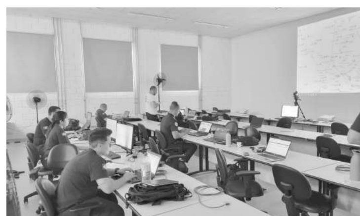
Plataforma tem integração da GM e outras instituições

Implantação está programada para o começo do mês de novembro deste ano