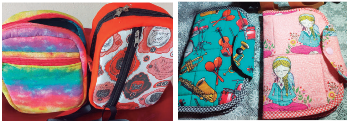
Faz costura criativa de bolsas, nécessaire, carteiras, estojos, entre outros para venda