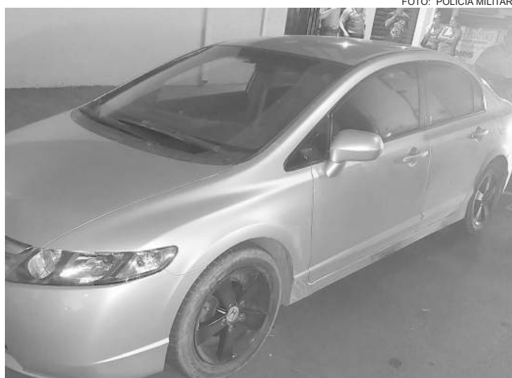
Veículo estava com as placas adulteradas

Carro foi abandonado com a chave no contato