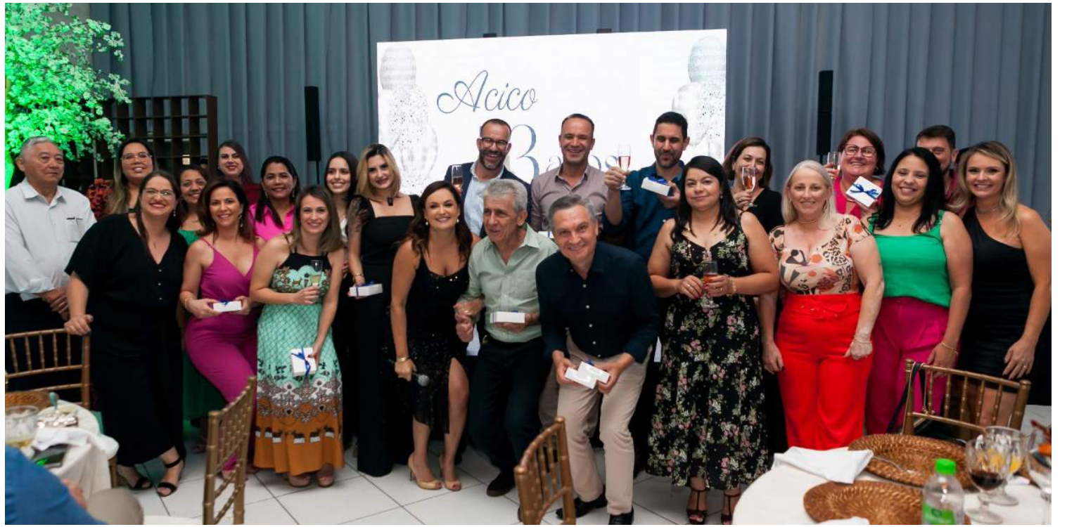
Equipe completa da Acico junto com diretores e patrocinadores