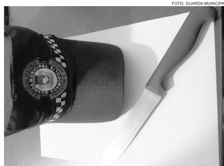
Ele alegou aos policiais ter feito uso de bebida alcoólica e entorpecentes

Ocorrência aconteceu no bairro Jardim Eldorado