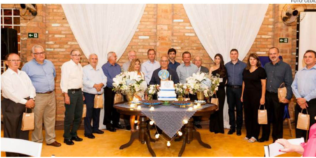
Diretores, presidente atual e ex-presidentes