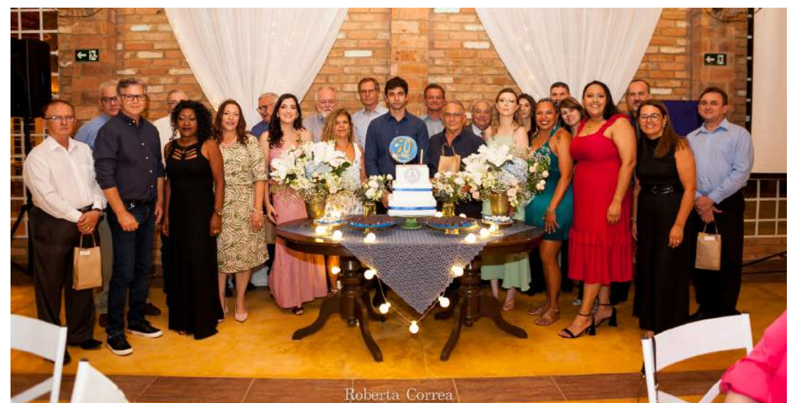
Diretores e funcionários