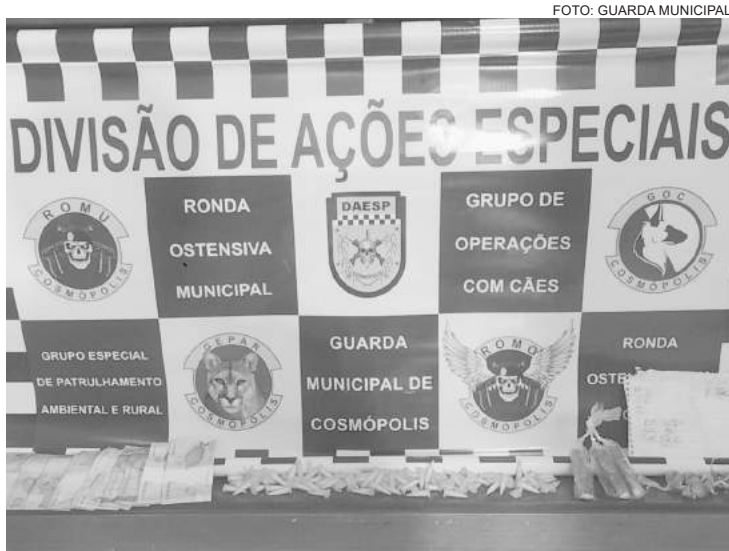
A ROMU surpreendeu um suspeito, que estava no tráfico de entorpecentes

Já no bolso da blusa de moletom, foram encontrados R$ 167,75 em notas diversas