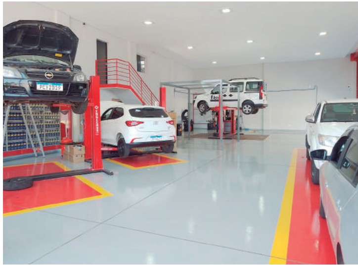
Loja ampla e espaçosa, com sala de espera para prestar melhor atendimento ao cliente

“Tudo começou com a primeira loja na Rua Marcelo Lugli, 259, com um espaço físico de 150 metros. Com o crescimento, as instalações se tornaram pequenas. Adquirimos um novo terreno e construímos mais uma loja na Rua Marcelo Lugli, 250, esquina com Antonio Carlos Nogueira, bem mais ampla, com equipamentos de última geração, e espaço interno de 300 metros, estacionamento de 5 metros livres e mais a