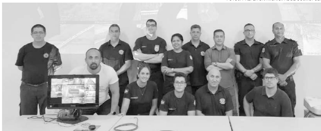
O novo sistema será preparado para atender a realidade e a necessidade local