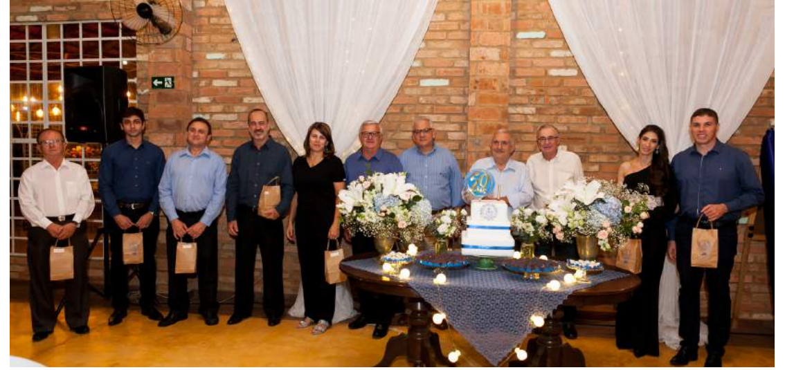
Diretoria e conselho atual