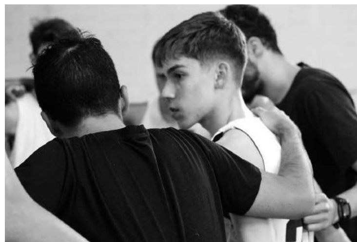
A união da equipe faz toda diferença no resultado

E os avanços não foram apenas em volume de participantes, mas também nos resultados. Todas as categorias terminaram a primeira fase entre os quatro primeiros de seus respectivos grupos e, com isso, alcançaram a elite da competição, a qual é chamada de Série Ouro. Uma vez entre os melhores, os Blue Wings seguiram competitivos e chegaram forte para a última fase, os playoffs. O Sub14 fechou em segundo lugar e fará a semifinal em casa, enquanto que o Sub16 fechou em primeiro e, por isso, decidirá a Liga em casa. O Sub18 terminou em terceiro e agora enfrenta Hortolândia na