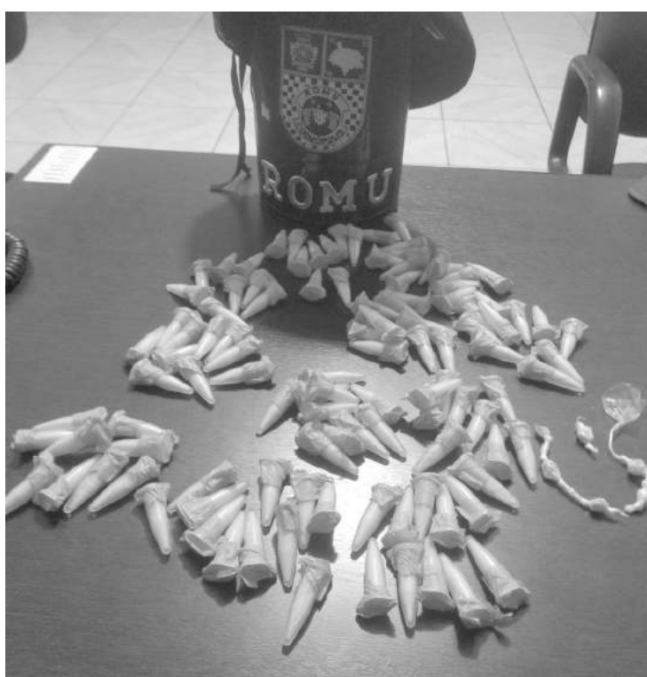
Foram apreendidos os seguintes entorpecentes: 110 unidades de cocaína em pinos; 6 unidades de crack

Condutor abandonou o carro com a porta aberta e fugiu