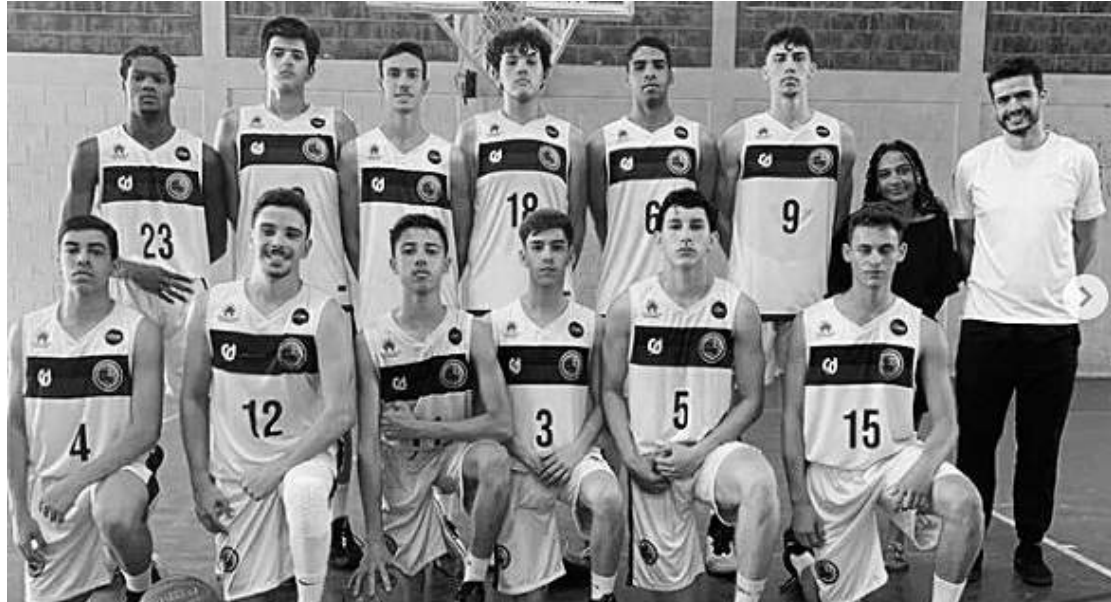
Equipe Blue Wings

Times alcançaram a 'elite' da competição