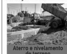
Aterro e nivelamento de terreno

Locação de máquinas: Retro escavadeira, Mini Pá Carregadeira, Escavadeira Hidráulica, mini escavadeira hidráulica, Pá Carregadeira. Locação de caminhão: Caminhão Basculante, Rollon Rolloff