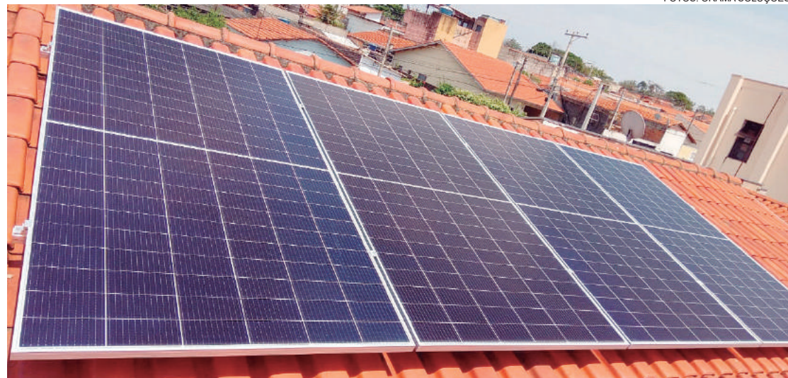
Energia solar é limpa proveniente do sol, fonte inesgotável

Solicite orçamento pelo telefone ou whatsapp (19) 97171-4125 ou (19) 98339-2104