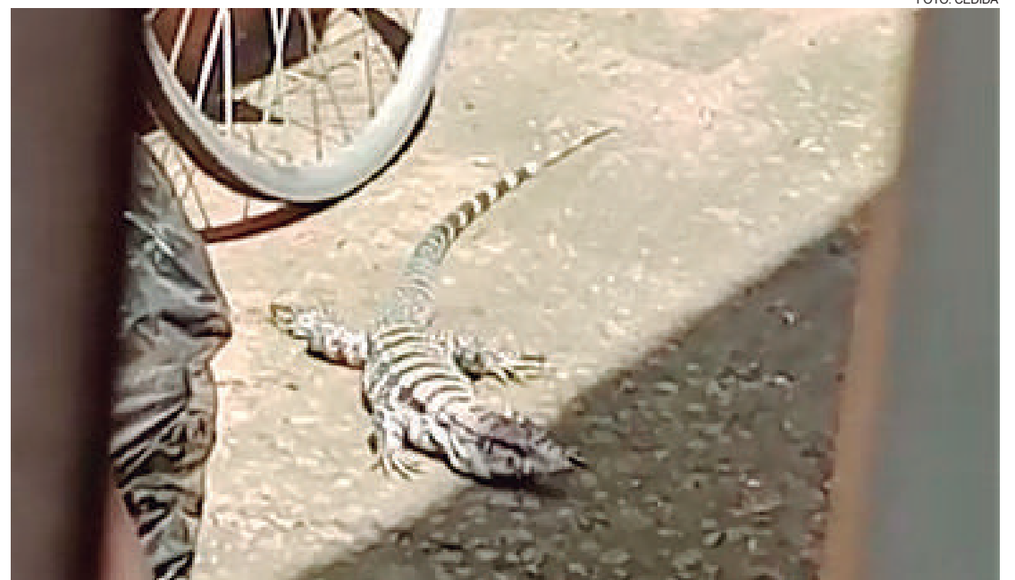
Lagarto Teiú [espécie que compreende os lagartos grandes] invadiu uma residência no Parque São Pedro. Moradores contam que ele ficou ali por um bom tempo, mas depois saiu sentindo a mata, todo independente...