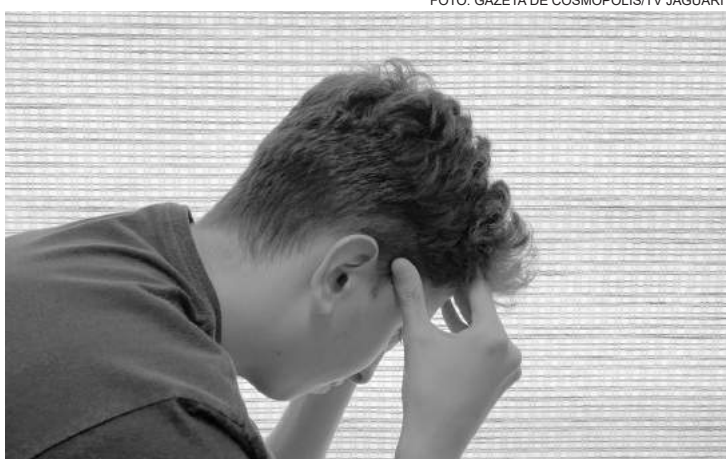
Toda dor de cabeça precisa ser avaliada por um médico

O que significa sentir dor frequente em um lado da cabeça? Quais as causas da dor de cabeça frequente? As dores unilaterais mais frequentes são