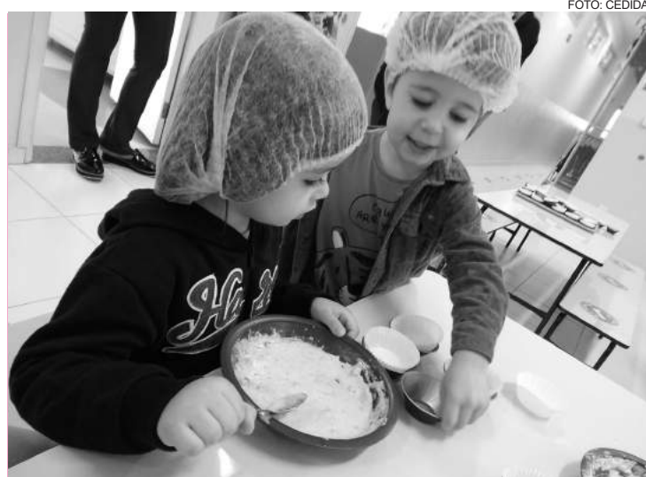
"Podemos dizer que a vida é um empreender constante"

Quando trabalhamos o empreendedorismo com as crianças, estamos estimulando e desenvolvendo atitudes, comportamentos, habilidades e competências importantes para o sucesso pessoal, acadêmico e profissional,