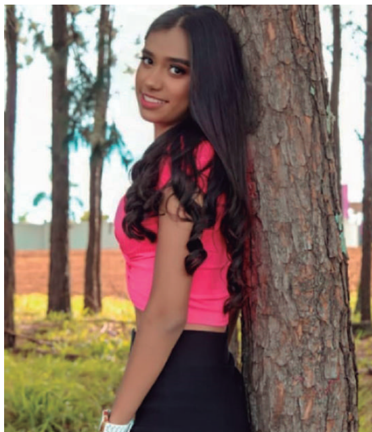
"Nunca permita que alguém corte suas asas, estireite seus horizontes e tire as estrelas do teu céu"

Deixe sua mensagem: Nunca permita que alguém corte