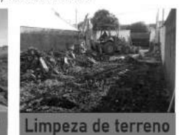
Limpeza de terreno