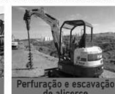
Perfuração e escavação de alicerce