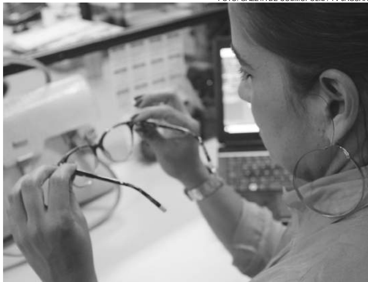
O ideal é visitar o oftalmologista ao menos uma vez ao ano

Existem vários motivos que podem deixar os nossos olhos vermelhos ou inchados, seja por exposição a fatores externos, como: cloro e radiação solar; ou por infecções bacterianas, ou virais. Exemplos de doenças relacionadas a vermelhidão: glaucoma, uveíte, esclerite ou conjuntivite.