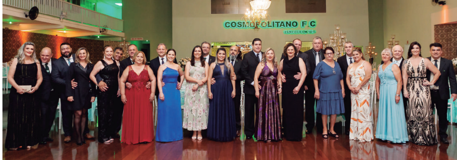
Diretoria do Cosmopolitano F. C. reunida