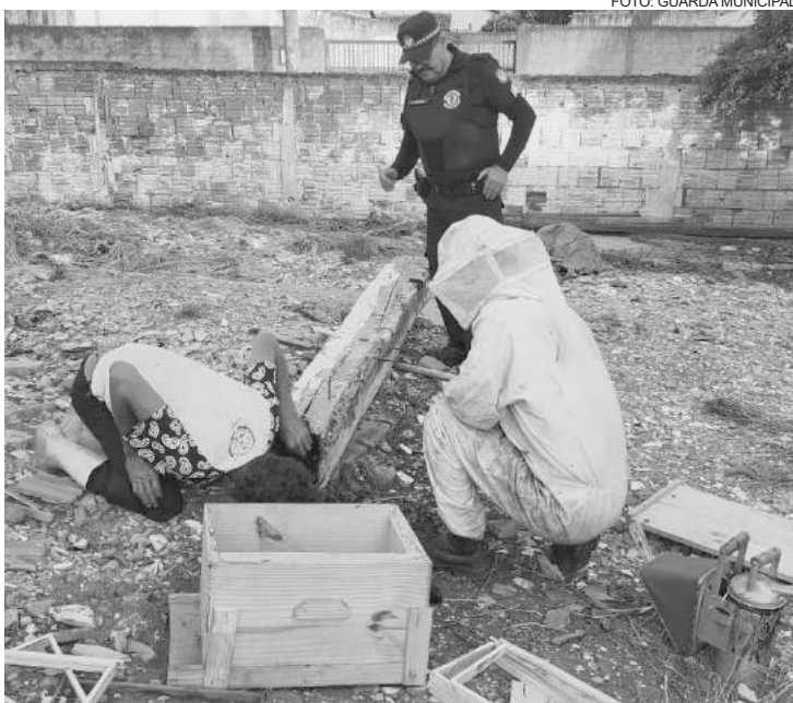
As abelhas estavam aglomeradas em um pedaço de madeira velha

“As abelhas foram capturadas, colocadas em caixas apropriadas e levadas a um