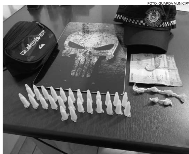
Foram apreendidos microtubos de cocaína, pedras de crack e dinheiro

Dentro dela, havia uma porção de entorpecentes, juntamente com uma quantia em dinheiro.