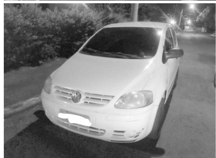
Foi questionado ao condutor o motivo da fuga e ele informou aos GMs que seu veículo encontrava-se com a documentação atrasada

veículo foi guinchado/recolhido pelo guincho Capela e encaminhado ao pátio local.