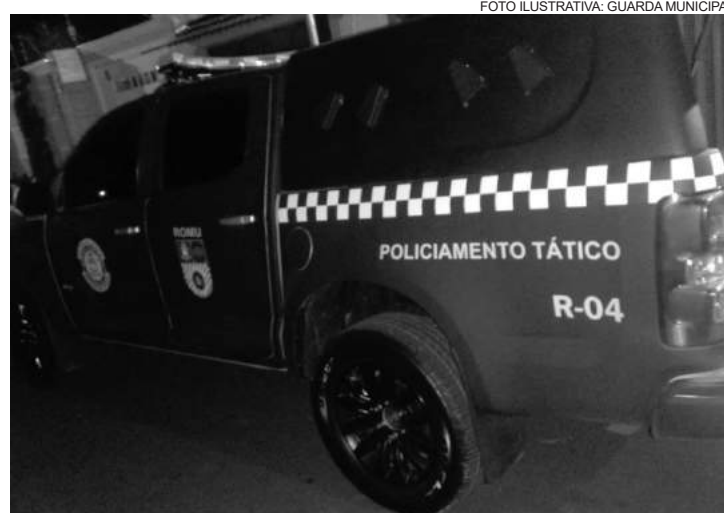
Homem foi localizado na Rua Guilhermina Kowalesky

A equipe de ROMU, durante patrulhamento pela cidade, adentrou no referido local, momento em que os Guardas Municipais lograram êxito em avistar um indivíduo, com mandados de prisão em aberto. De imediato, foi realizada busca pessoal nele, mas, nada de ilícito foi encontrado.