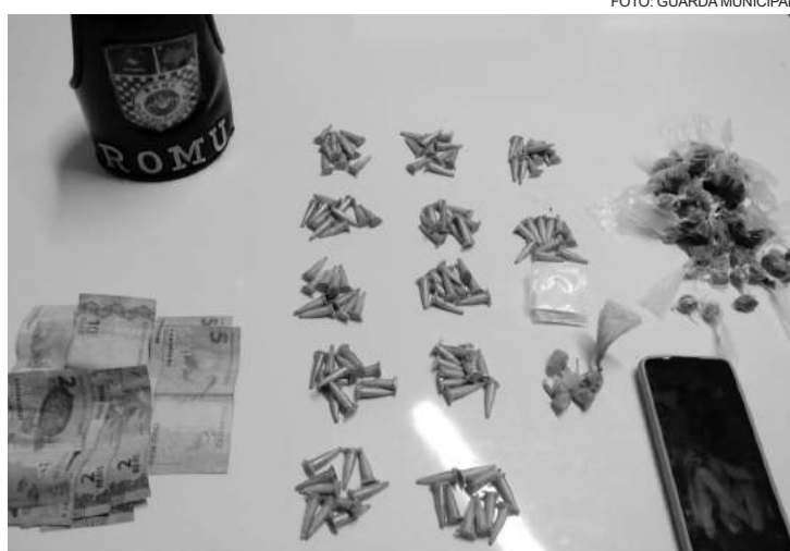
Indivíduo empreendeu fuga, mas, foi abordado em seguida

Foi feita busca pessoal e foi localizado, em seu bolso, 01 microtubo de substância branca, aparentando ser cocaína. No chão, onde o mesmo foi abordado, foi encontrada uma sacola de cor verde, contendo