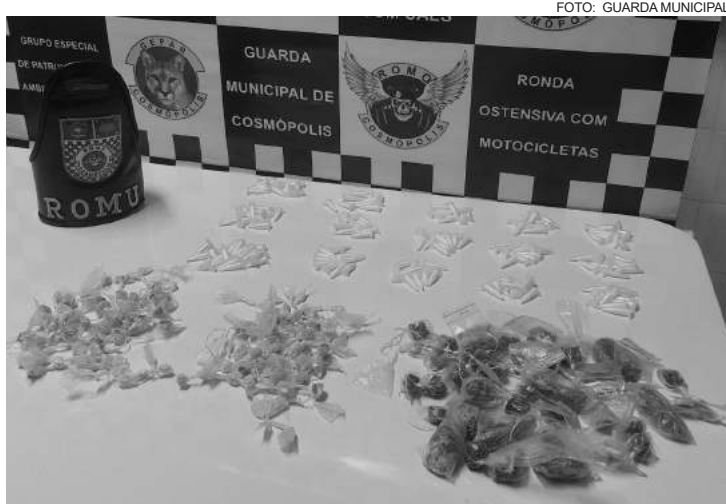
Drogas foram encontradas na Rua Valter Dester

A equipe de ROMU, durante patrulhamento, adentrou no referido local, na comunidade, e realizou incursão pelas vielas e becos, quando foram avistados dois indivíduos. Um deles, ao perceber a chegada da equipe, arremessou uma sacola plástica em uma casa na rua, sendo de imediato abordado. Foi solicitada permissão à moradora da residência para procurar a sacola, que foi encontrada contendo os seguintes materiais: 50 porções com substâncias brancas aparentando ser cocaína; 29 porções de substâncias verdes aparentando ser maconha; 62 porções de substâncias amarelas aparentando ser crack.