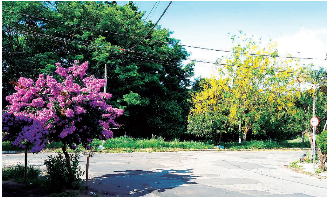
Diversidade de cores e espécies, que encantam quem passa pelo local, no cruzamento da rua Ramos de Azevedo com a rua Adão Martelli