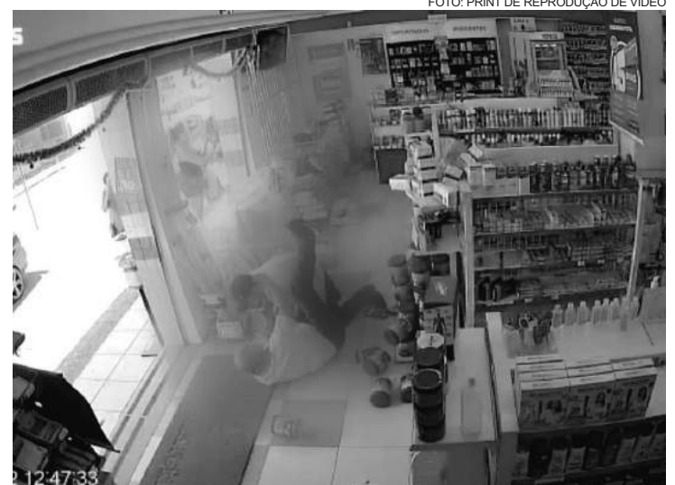
Vítima sofreu uma sequência brutal de socos

Na noite de sexta-feira (09), às 23h, uma mulher foi salva pelas equipes da Guarda Municipal (GM) após tentar entrar na frente de um caminhão no