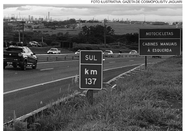
O acidente aconteceu no km 137, no bairro Uirapuru

O balconista se levanta e volta para dentro da drogaria, onde é amparado pelos funcionários e clientes, que trazem água e uma cadeira.