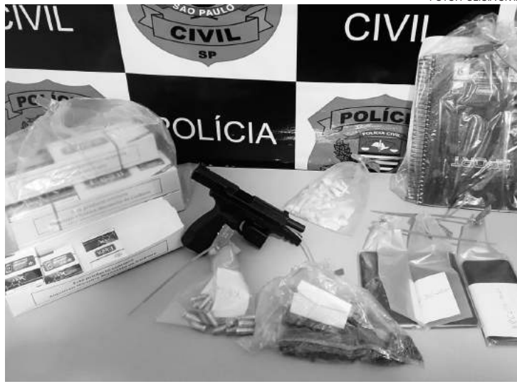
O preso foi atuado em flagrante delito

Durante operação policial que visava o cumprimento de mandado de busca concedido pelo juízo da cidade de Cosmópolis, Policiais Cíveis de Cosmópolis, Americana (DIG) e Artur Nogueira, com o apoio da Guarda Civil local, efetuaram a prisão do indivíduo, após o mesmo evadir-se de sua residência, pois fora locali-