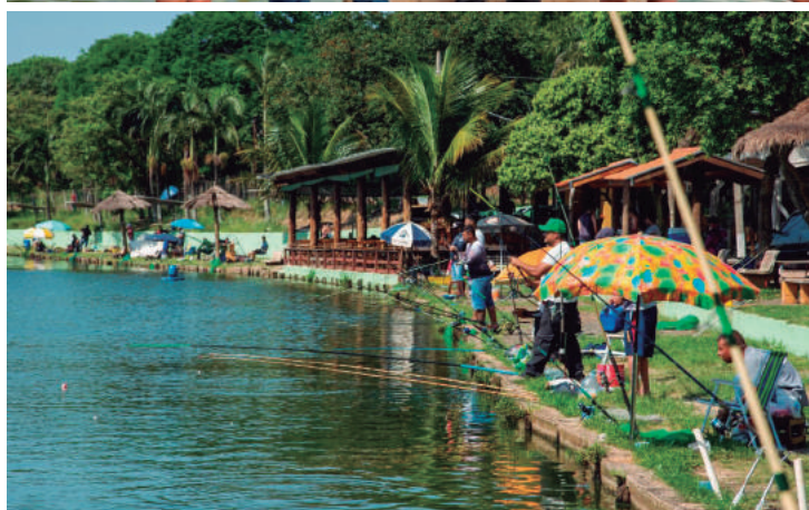
107 pescadores se inscreveram para o torneio

de Itobi, que pescou 41,2 kg; 2º lugar - Márcio Cunha, de Nova Odessa, que pescou 40,1 kg; 3º lugar - Júlio, também de Nova Odessa, com 31,3 kg; e no 4º lugar, Eliseu, de Hortolândia, que pescou 26,3 kg.