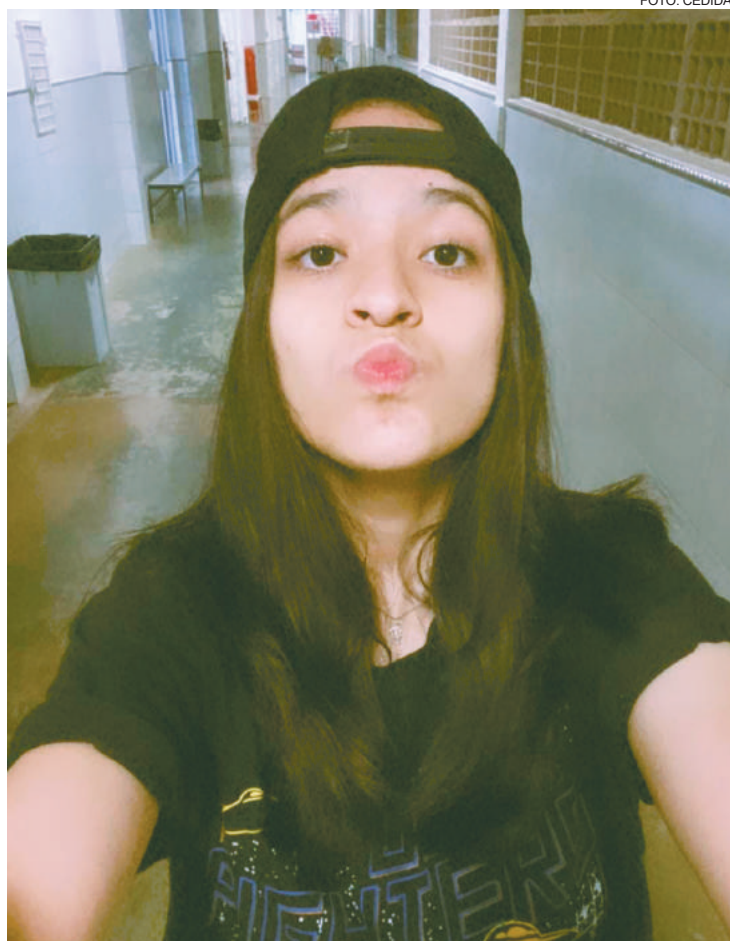
Lais quer ser Psiquiatria

Deixe sua mensagem: "Até os jovens se cansam e ficam exaustos, mas aqueles que