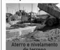
Aterro e nivelamento de terreno

Locação de máquinas: Retro escavadeira, Mini Pá Carregadeira, Escavadeira Hidráulica, mini escavadeira hidráulica, Pá Carregadeira. Locação de caminhão: Caminhão Basculante, Rollon Rollof