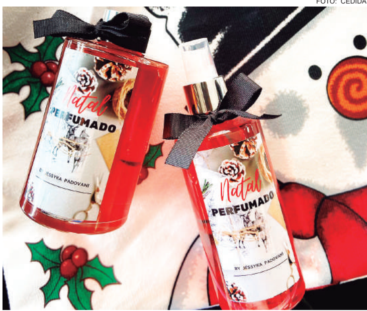
Difusores personalizados com cheiro especial

Recomendo utilizar Águas perfumadas para tecidos,