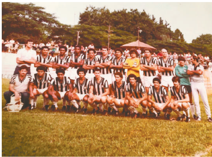
Equipe cosmopolense demonstrou garra e levou o nome de Cosmópolis para todo o estado de São Paulo