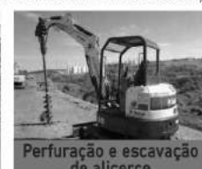
Perfuração e escavação de alicerce