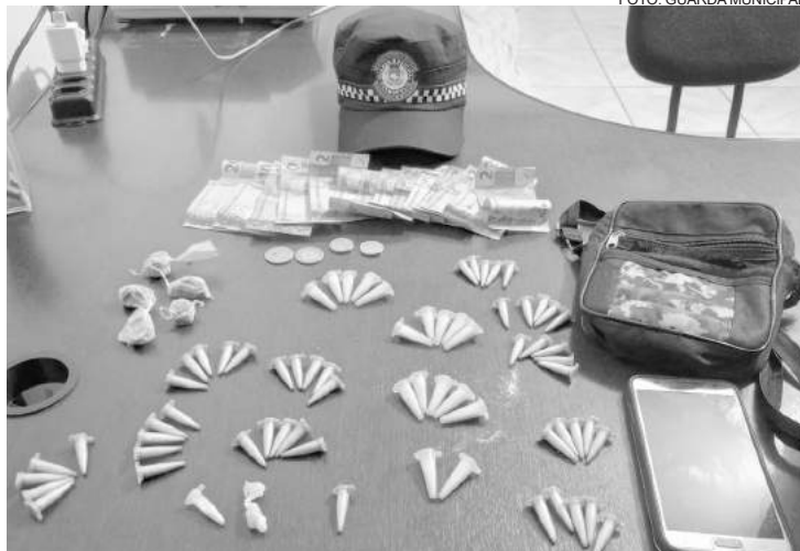
Ao todo, foram apreendidas 76 unidades de drogas

Ele foi conduzido ao Pronto Atendimento da Santa Casa de Misericórdia para Exame de