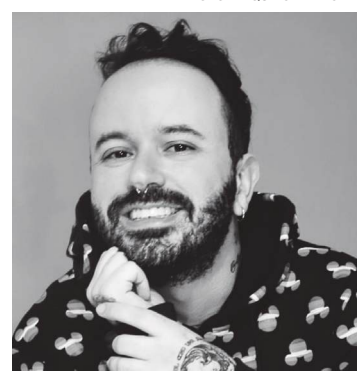
Juh Brilliant Escritor, pedagogo e fotógrafo @juh-brilliant