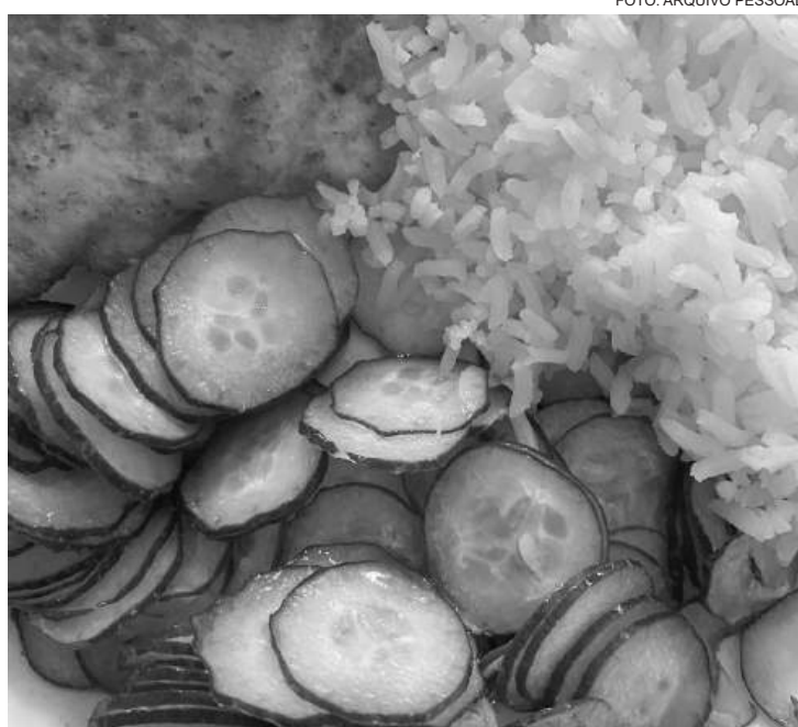
Ingestão calórica deve ser adequada às necessidades do indivíduo

Segundo o livro Nutrição Clínica no Adulto, de Lilian Cuppari, o metabolismo humano segue um ritmo circadiano, com alterações no gasto energético ao longo do dia. Durante o sono, o corpo não interrompe suas atividades metabólicas, mas reduz a taxa metabólica. Isso