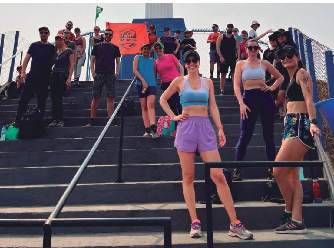
Grupo 'Na Trilha' prestigia o potencial natural de Cosmópolis