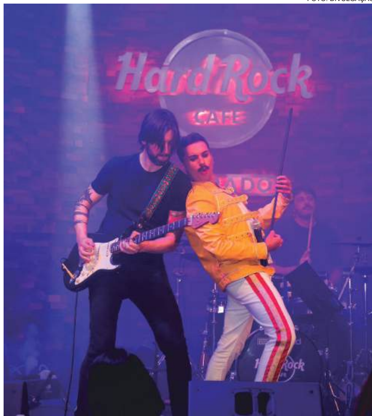
Celebração será na noite do dia 27 de outubro (domingo)

Criada em 2009, a Villa-Musical nasceu como um projeto e, ao longo dos anos, evoluiu para se tornar uma instituição reconhecida na cidade. "Nós