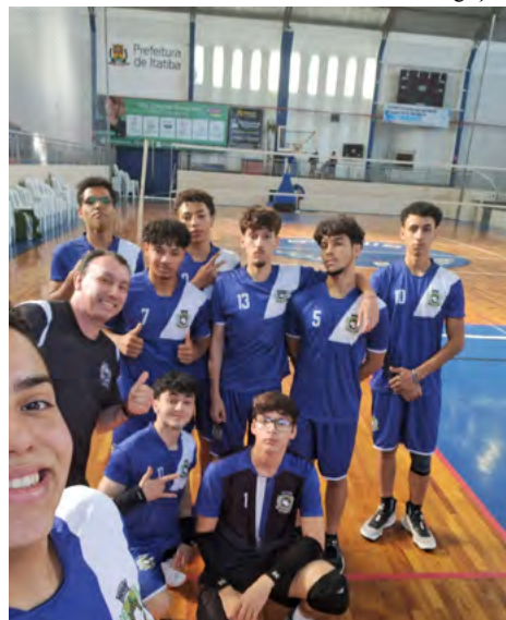
Partida acontece no Ginásio Municipal de Esportes “Antônio Damiano”, às 14h, com entrada gratuita para o público

A equipe Sub-19 Masculina de Cosmópolis joga neste sábado (02), às 14h, contra o time de Itatiba pela Copa Itatiba. A partida será no Ginásio Municipal de Esportes “Antônio Damiano”, com entrada aberta ao público. O confronto faz parte de uma rodada tripla da competição regional: às 15h30, jogam as equipes Sub-21 Masculina (EVLA x Itatiba) e, às 17h, o Sub-21 Feminino (EVLA x Bragança). A Copa reúne times de diferentes cidades e categorias, promovendo integração e desenvolvimento esportivo. Representando o município, o time da Secretaria Municipal de Esportes (SEC) busca manter o desempenho e somar pontos na tabela. A Copa é uma oportunidade de calendário para o desenvolvimento técnico dos atletas e contribui para o fortalecimento das atividades esportivas entre os participantes.