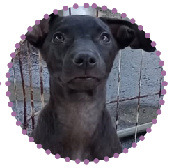
MACHO - 3 MESES

Os cachorrinhos das fotos acima estarão disponíveis na feira de adoção da 'Mudando Destinos' neste sábado (01), que acontecerá na Rua Dr. Campos Sales. Leve seu RG e comprovante de residência. Você pode entrar em contato com os responsáveis pelo Facebook: Mudando Destinos. Ao adotar um animal, você está fazendo a diferença. Além de proporcionar