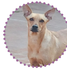
MACHO - CASTRADO

Essa ação beneficia ambas as partes, tanto o bichinho como o tutor, que tal levar um amigo para casa?