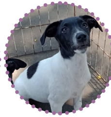
MACHO - CASTRADO