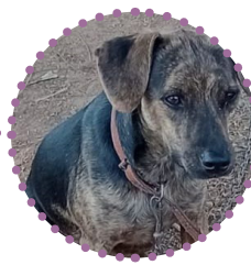
MACHO - CASTRADO