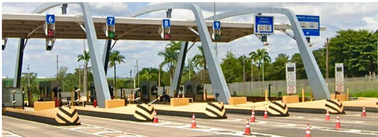
Os parlamentares temem que o pedágio dificulte o deslocamento diário e esperam que o Estado reavalie a decisão. Pág. 7

O pedido, idealizado por Jackson Teixeira e assinado por todos os vereadores, foi enviado ao governador Tarcísio de Freitas