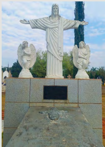
Cemitério do Cascalho Cordeirópolis/SP