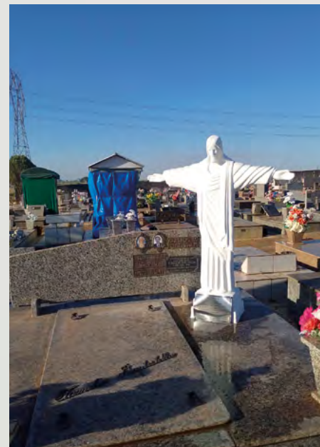
Cemitério de Cosmópolis/SP