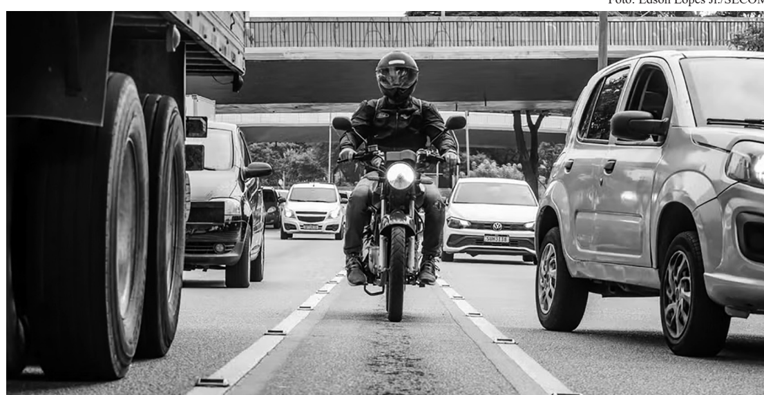
Faixa azul em SP

Por estar em fase inicial, a definição de expansão para outras vias e