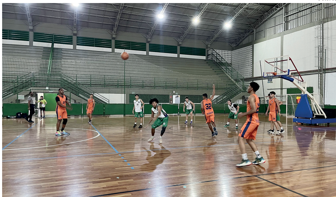
time fez o 38º ponto no terceiro quarto.

O time de Paulínia começou com dificuldade no primeiro quarto e acabou perdendo de 19 a 11. A compensação veio no segundo quarto, quando reagiu e marcou 20 a 15 pontos. No terceiro momento, o jogo virou a favor de Paulínia, quando o